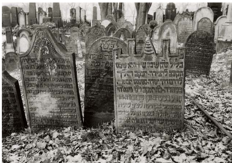
hřbitov – tvarově různorodé náhrobky z počátku 19. století (foto r. 1983)