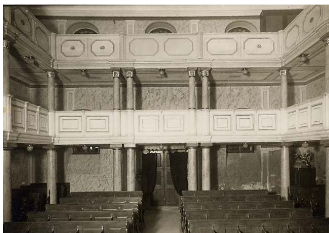
synagoga – západní strana sálu s ženskými galeriemi (foto kolem r. 1941)