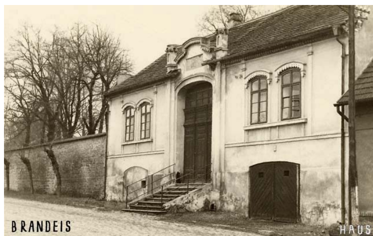
hřbitov – obřadní budova s bytem hrobníka (foto kolem r. 1941)