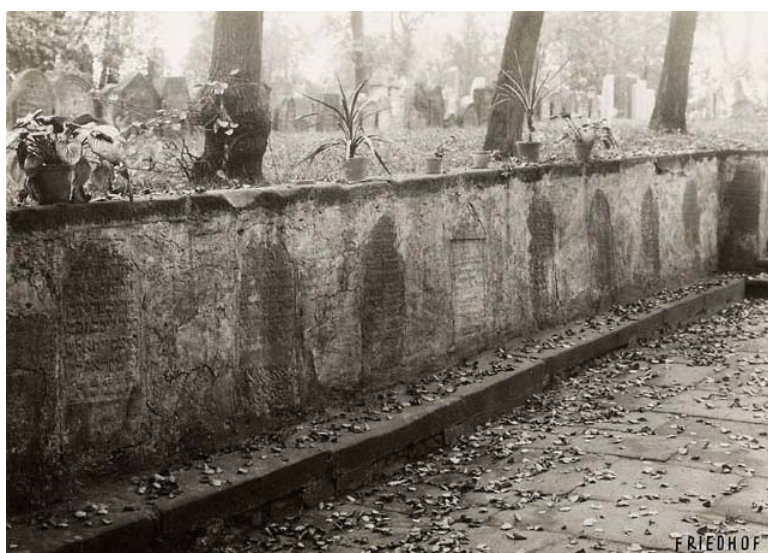
hřbitov – druhotně umístěné náhrobky (foto kolem r. 1941)