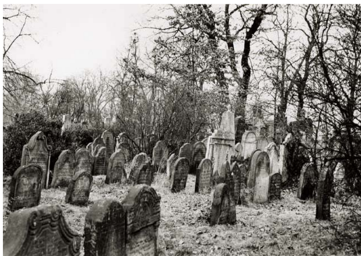
hřbitov (foto r. 1978)