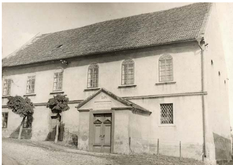
synagoga – západní (vstupní) průčelí s obytnou částí (foto kolem r. 1941)