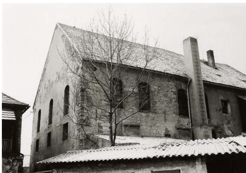
synagoga – jižní a východní průčelí (foto r. 1983)