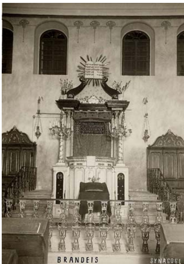
synagoga – východní stěna s aronem ha-kodeš (foto kolem r. 1941)