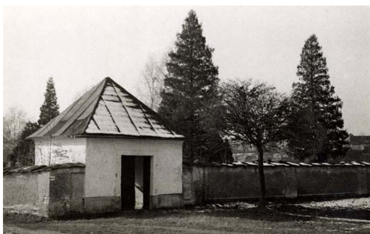
márnice – vstup do hřbitova (foto kolem r. 1941)