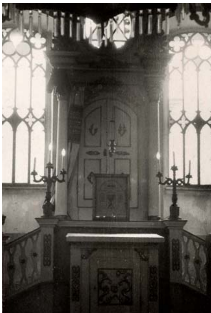
synagoga – aron ha-kodeš (foto kolem r. 1941)