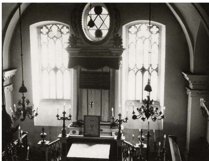
synagoga – pohled z ženské galerie k východní stěně (foto kolem r. 1941)