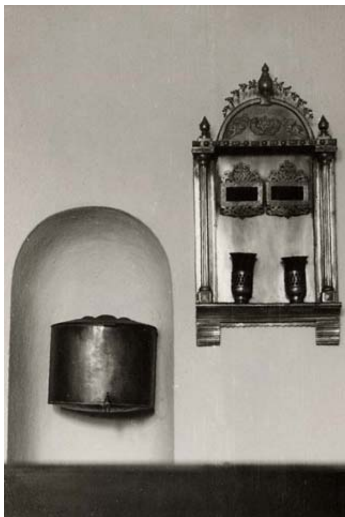
synagoga – detail interiéru s kijorem (rituálním umývadlem) a jahrzeitovými (zádušními) svítidly (foto kolem r. 1941)