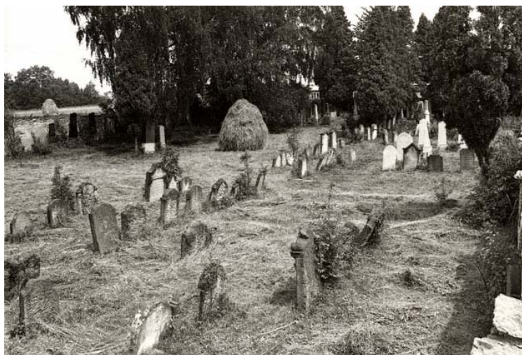
hřbitov (foto před r. 1980)