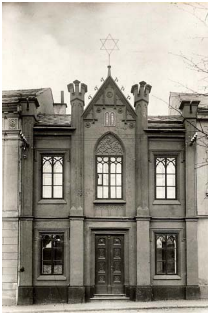
synagoga – západní (vstupní) průčelí (foto kolem r. 1930)