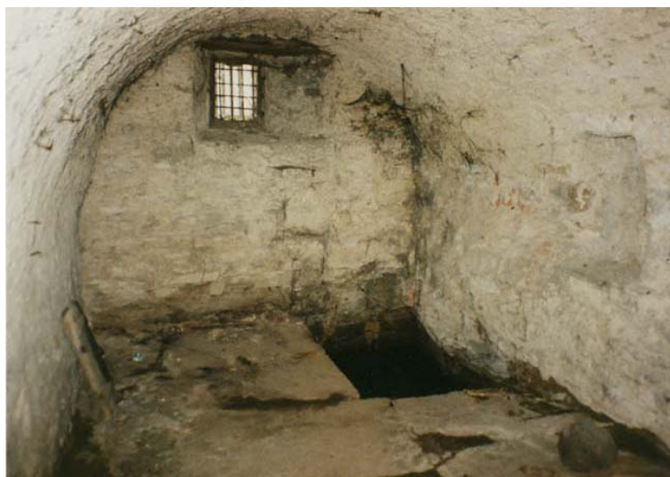
mikve v přízemí budovy Městského muzea (foto A. Pařík, 1995)