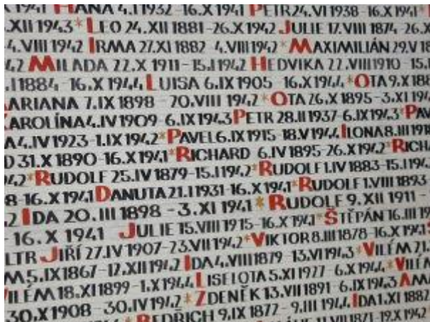
Jména českých a moravských obětí holocaustu na stěnách Pinkasovy synagogy v Praze

málokdo dokáže představit atmosféru, která vznik památníku v Pinkasově synagoze provázela, a zejména obdivuhodný výkon jeho ideové autorky v boji s totalitním režimem.