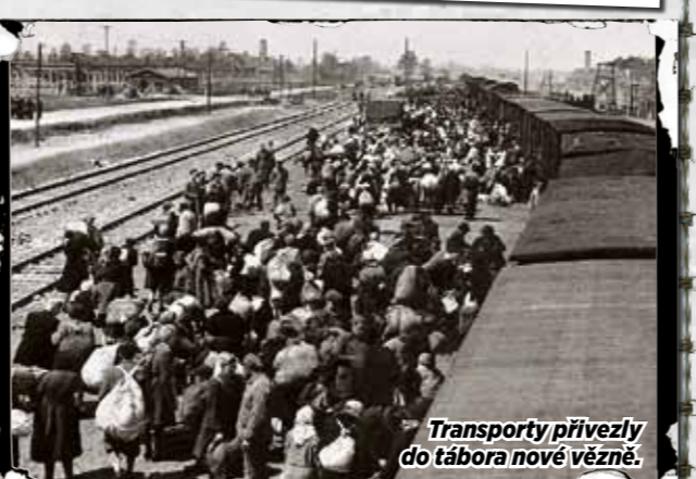
Transporty přivezly do tábora nové vězně.