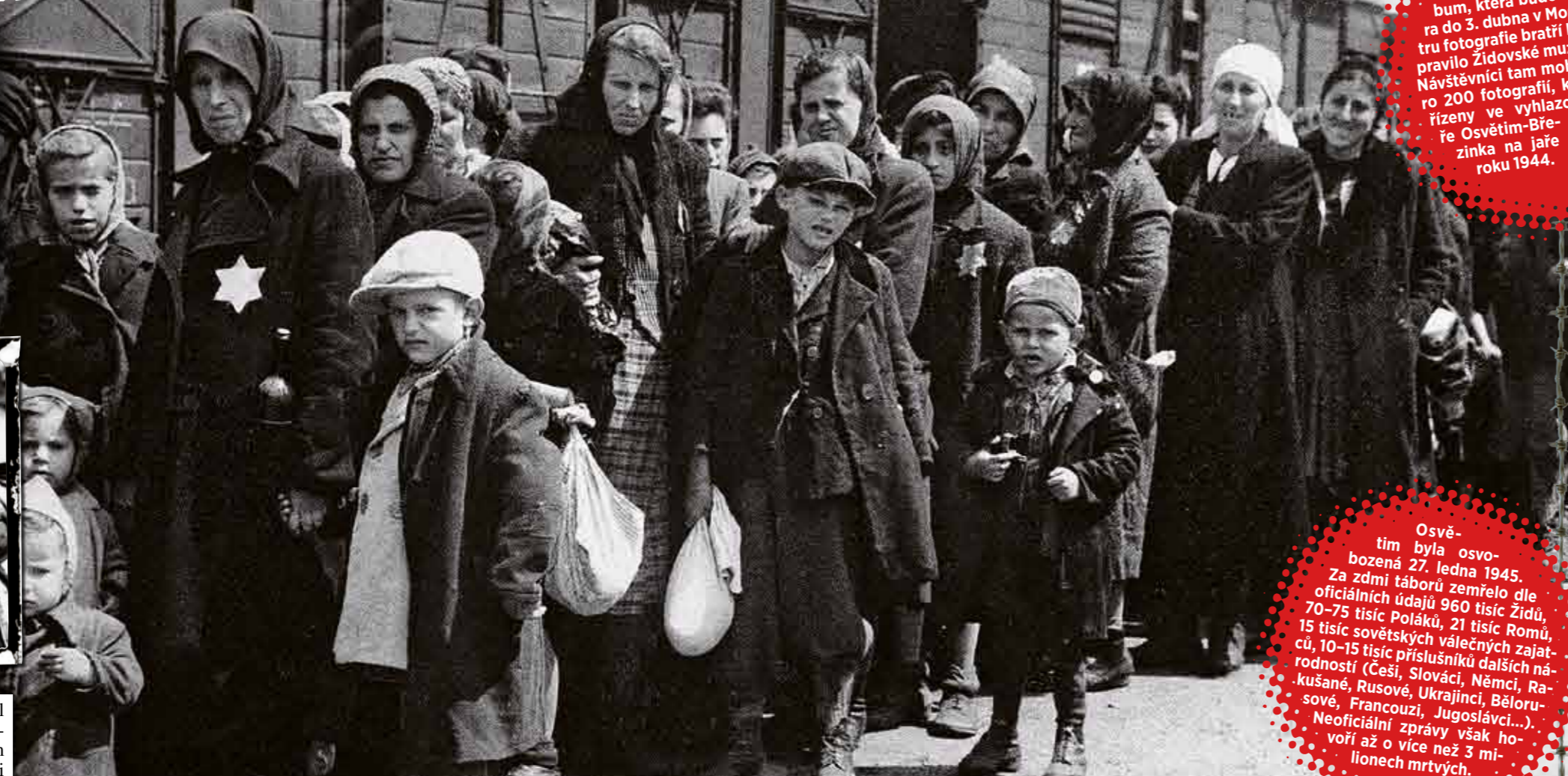
Cechoslováci, mezi nimiž byly i ženy a děti, fotili při cestě na smrt sami nacisté.