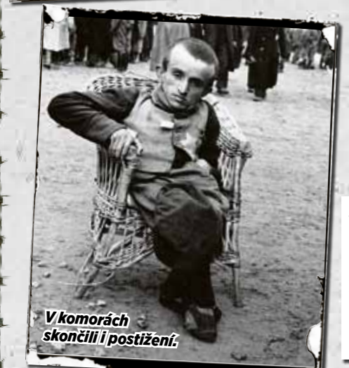
V komorách skončili i postižení.

ven!“ Fvali pak na nás. „Každý půjde samostatně, žádné držení za ruce!“ Nevěděl jsem, že osoba, která drží za ruku dítě, skončí v plynu s ním. Můj otec neměl ještě ani padesát, ale s mým bratrem odešel do plynové komory.