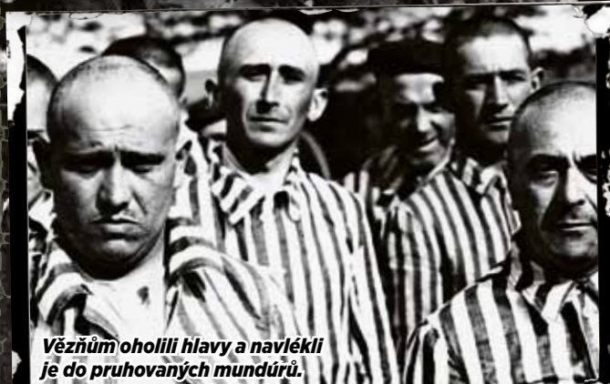
Vězňům oholili hlavy a navlékli je do pruhovaných mundurů.

Text: Veronika Kynclová a sbírka Rozhovory s pamětníky ZMP Foto: Židovské muzeum v Praze Většinu lidí čekala v lágru smrt v plynu, další byli zastřeleni, jiní zemřeli zimou, na povzdychu či vyčerpáním... Z příběhů těch, kterým se podařilo uniknout z nejdůležitějších svědectví za jedno z nejdůležitějších svědectví o osudu lidí, kteří byli v táboře zavražděni. Jedná se totiž o jediný autentický dokument, jenž život v tamním koncentráku zachycuje. Kromě tří fotografií, které pořídl tajně vězni, neexistuje žádná jiná!