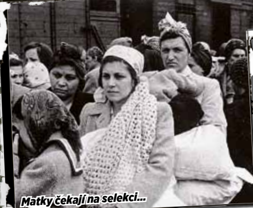
Matky čekají na selekci...