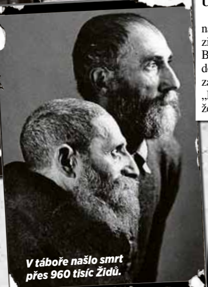
V táboře našlo smrt přes 960 tisíc Židů.