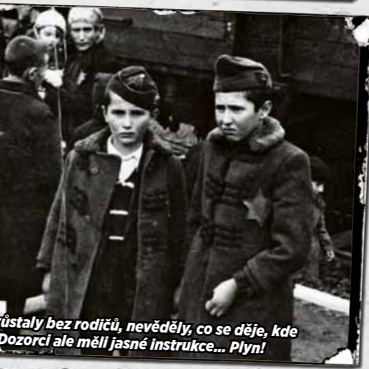
Děti zůstaly bez rodičů, nevěděly, co se děje, kde jsou. Dozorci ale měli jasné instrukce... Plyni!