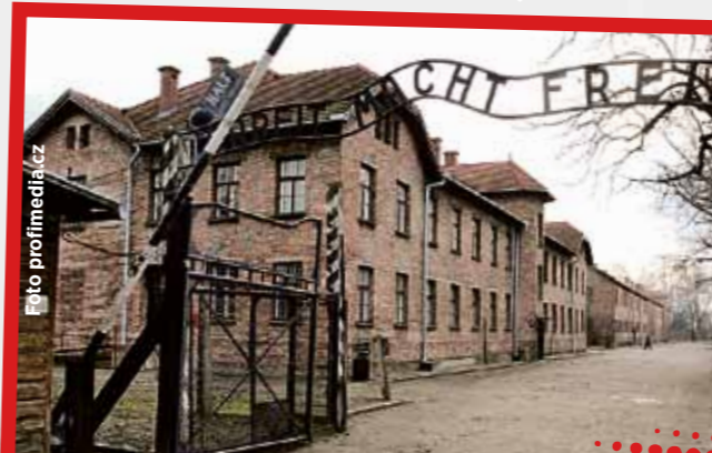
Věžně vítala v Osvětimi brána s nápisem Práce osvobozuje.