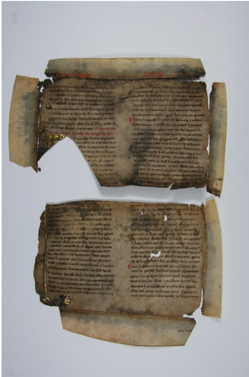
Fragment nalezeného rukopisu při restaurování starého tisku

fragment liturgického legendáře ve starofrancouzštině, popsaného Paulem Meyerem (viz Paul Meyer, "Notice sur un légendier français du XIIIe siècle classé selon l'ordre de l'année liturgique", in: Notices et extraits des manuscrits de la Bibliothèque Nationale , 36/1, Paris, 1899). Podle písma může být datován do první poloviny 14. st. Obsahuje konec Života sv. Blaisa a velkou část Života sv. Agáty . Text je psaný černo-červeným inkoustem s neobvykle dobře zachovalým zlacením iniciály a okraje folia. Objev a následné restaurování fragmentu rukopisu uskutečnili restaurátoři papíru ŽMP a fragment je uložen spolu se starým tiskem ve sbírce vzácných tisků v knihovně ŽMP.