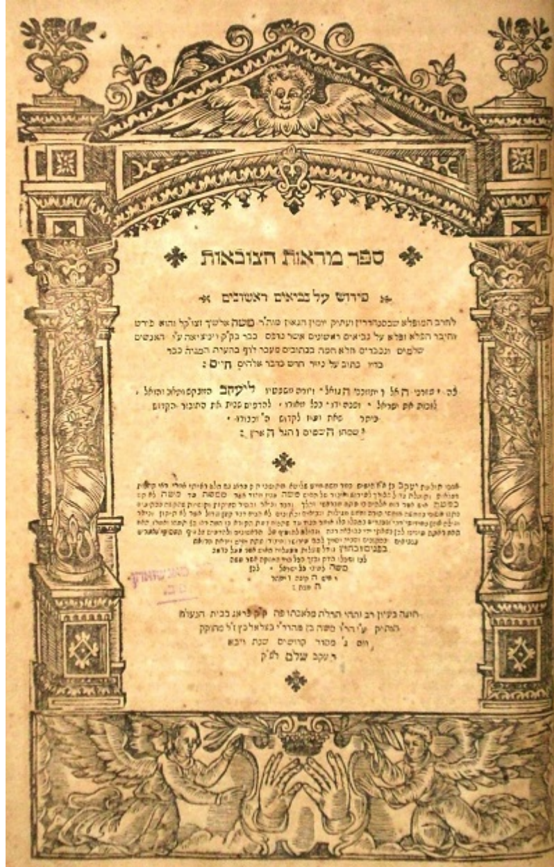
Moše ben Chaim Alšech: Mar'ot ha-cov'ot. Prag: Moše ben Becalel Katz, 1620, přír.č. 2016/0866