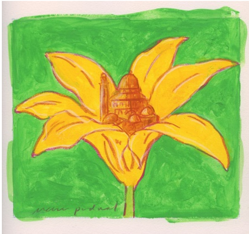
Mark Podwal – Píseň písni / Song of Songs (2:2), 2016. © Mark Podwal

Zveme vás ve středu 15. 2. od 15 hod. na komentovanou prohlídku výstavy „ Pojď, milý můj ... “ – Ilustrace k Písni písni v doprovodu kurátora Arno Paříka. Základní vstupné 40 Kč.