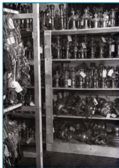
JEWISH MUSEUM IN PRAGUE 2016