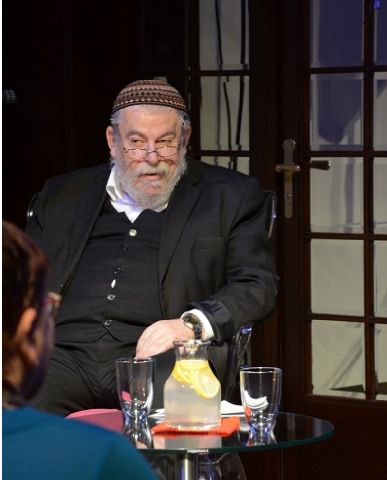
Vrchní zemský rabín Karol Efraim Sidon