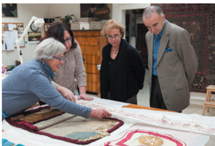
Na návštěvě v odboru sbírek ŽMP