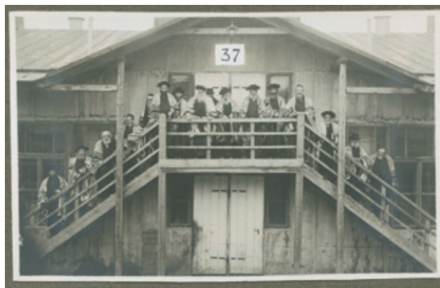
Aranžovaná fotografie židovských uprchlíků v barákovém táboře v Německém (dnes Havlíčkově) Brodu 1915-1917.

V první únorový den skončila v Galerii Roberta Guttmanna výstava o osudech uprchlíků v době první světové války, kterou muzeum uspořádalo ke stému výročí vypuknutí válečného konfliktu. Výstava sledovala osudy židovských uprchlíků do českých zemí na pozadí uprchlické politiky státu, vzniku uprchlických táborů a činnosti pomocných organizací. Návštěvníkům představila v České republice dosud nezveřejněné fotografie zachycující život uprchlíků, jejich ubytování či uprchlické tábory, ale i namluvené úryvky z dobových kronik a tisku.