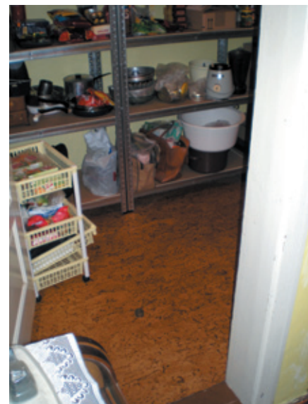
Místo nálezu knih zazděných v podlaze soukromého domu v Třešti