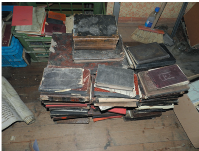
Knihy nalezené v Třešti