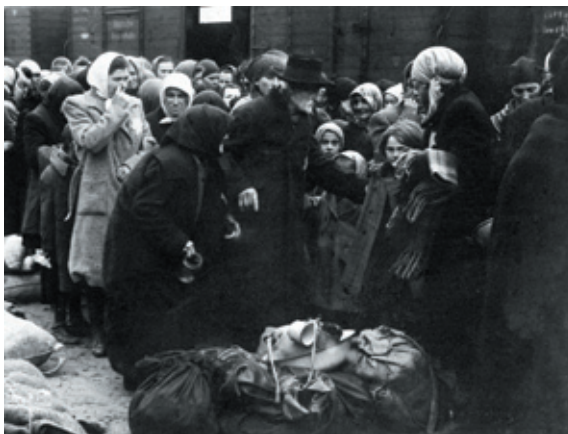
Fotografie z tzv. Osvětimského alba