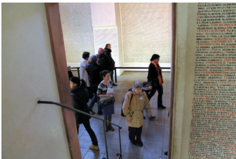
Dobrovolníci pomáhají v expozici Pinkasovy synagogy (8. březen 2015)

V Židovském muzeu v Praze funguje již řadu let dobrovolnický program. V jeho rámci pomáhají dobrovolníci v jednotlivých odděleních, například při organizaci večerních pořadů v Oddělení pro vzdělávání a kulturu, v archivu či ve sbírkovém oddělení. Od března 2015 začali dobrovolníci pomáhat i v expozicích muzea, konkrétně v Pinkasově synagoze. Zde pomáhají návštěvníkům především s orientací v expozici či hledáním jmen českých a moravských obětí šoa.