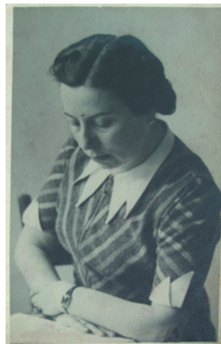
Gisi Fleischmann

Večerní program pražského Kina Světozor patřil 20. ledna 2015 premiéře dokumentárního filmu Gisi, mapujícího příběh výjimečné ženy, která uvěřila, že podaří-li se jí shromáždit dostatek finančních prostředků, dokáže zastavit holocaust. Gisi Fleischmann se v Bratislavě postavila do čela skupiny, která usilovala o zastavení transportů do vyhlazovacího tábora v Osvětimi. Zůstala by zcela zapomenuta, nebýt desítek dopisů, které rozeslala do celého světa ve snaze získat dva miliony dolarů – přesně tolik požadovali nacisté jako výkupné za slib záchrany části evropských Židů. Premiéru zorganizovalo Židovské muzeum v Praze ve spolupráci s Velvyslanectvím Státu Izrael v České republice a Židovskou obcí v Praze u příležitosti 70. výročí osvobození Osvětimi.