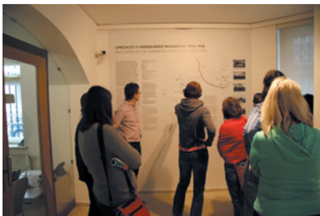
Učitelé na výstavě Orient v Čechách? Židovští uprchlíci za první světové války

Cílem dvoudenního semináře bylo seznámit učitele českých a moravských škol na příkladu židovských uprchlíků s tématem uprchlictví nejen ve 20. století, ale i v současnosti. Seminář reagoval na zjištění, že téma migrace a uprchlíků nehraje v českých kurikulárních dokumentech, stejně jako ve vzdělávací praxi, téměř žádnou roli. Bezprostředním podnětem pro uspořádání semináře byla možnost využít výstavy v Galerii Roberta Guttmanna Orient v Čechách? Židovští uprchlíci za první světové války , jejímž cílem bylo seznámit návštěvníky s tímto zapomenutým prvním významným setkáním obyvatel českých zemí s uprchlíky.