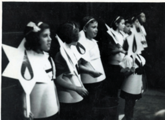
Oslava židovského svátku Chanuka, Praha, prosinec 1945

Židovské muzeum v Praze – Galerie Roberta Guttmanna, U Staré školy 3, Praha 1 Otevřeno denně kromě sobot a židovských svátků 9–18 h.