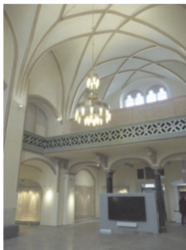
Rekonstruovaná Maiselova synagoga před instalací nové expozice