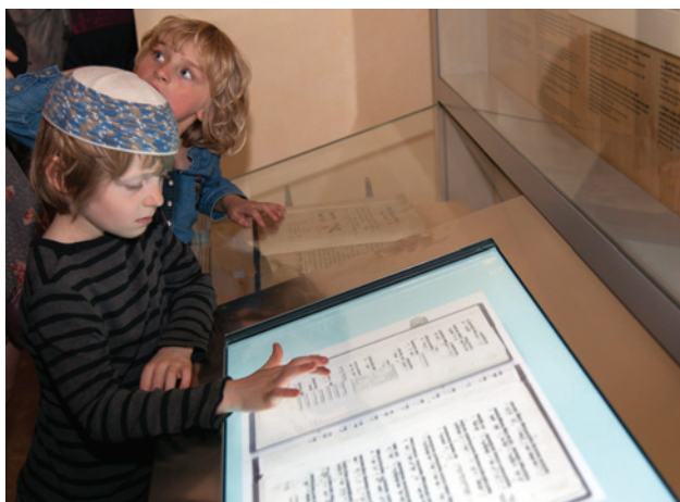
Slavnostního otevření nové expozice se 30. června zúčastnilo na dvě stě hostů

Zpřístupnění Maiselovy synagogy je po loňském otevření Informačního a rezervačního centra v Maiselově ulici 15 dalším počinem v postupné transformaci muzea v atraktivnější, návštěvnicky poutavější kulturní instituci.