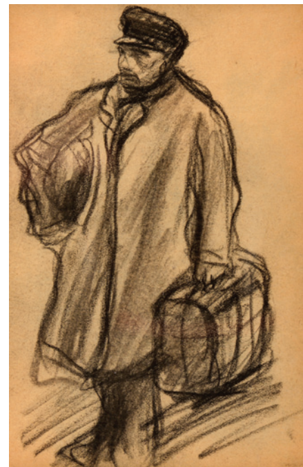
Kresba z díla Eugeena van Mieghema

Galerie Roberta Guttmanna, U Staré školy 3, Praha 1