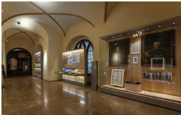
Pohled do nové stálé expozice v Maiselově synagoze

Nová expozice ŽIDÉ V ČESKÝCH ZEMÍCH, 10. – 18. STOLETÍ obsahově staví na expozici předchozí, tematicky obdobné. Zároveň však zapracovává nejnovější výsledky bádání a činí téma přitažlivějším novým uspořádáním, výběrem exponátů a zařazením audiovizuálních a interaktivních prvků. Za povšimnutí stojí obzvláště několikaminutový průlet pražským Židovským Městem podle Langweilova modelu Prahy v jeho podobě před asanací.