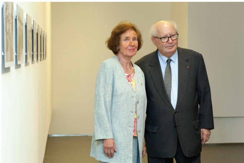
Manželé Klarsfeldovi na výstavě Osvětimské album