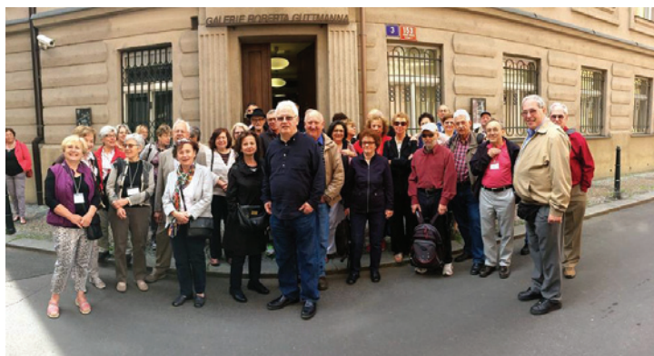
Tzv. Děti Maiselovky před Galerií Roberta Guttmana.

V neděli 23. 8. v 16 hod. vás zveme na komentovanou prohlídku výstavy Zmařené naděje: Poválečné Československo jako křižovatka židovských osudů v doprovodu jejího autora, filmového dokumentaristy Martina Šmoka. Základní vstupné 40 Kč.