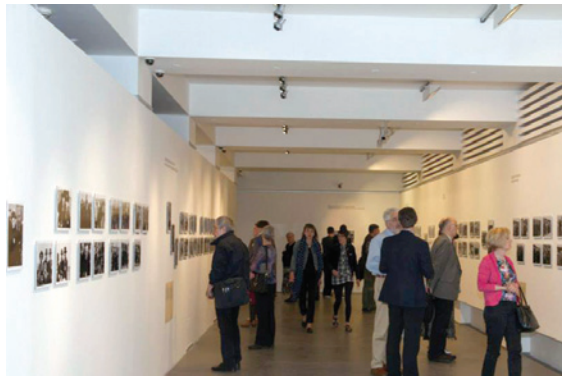
Vernisáž výstavy Osvětinské album proběhla 18. května 2015