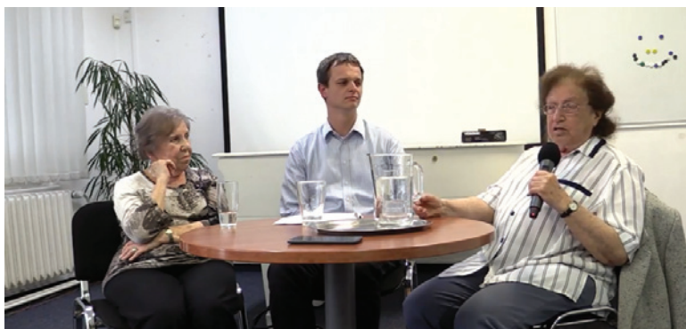
Z cyklu Naše 20. století