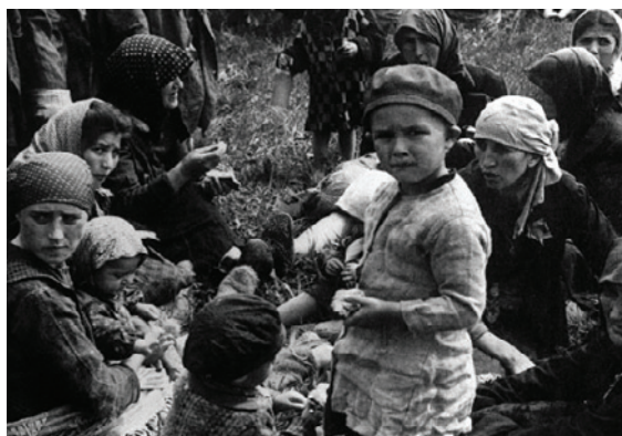
Fotografie z tzv. Osvětinského alba