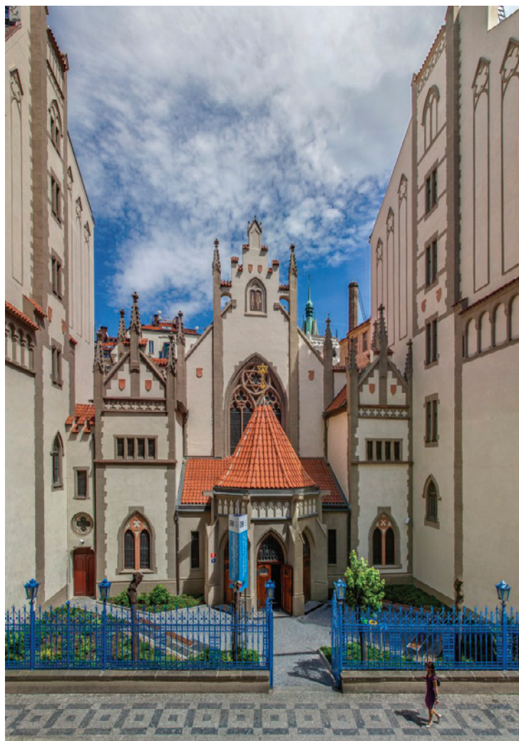
Maiselova synagoga, pohled z Maiselovy ulice

Maiselova synagoga v Praze, jedna z dominant někdejšího pražského Židovského Města, se 1. července 2015 po více než roce opět otevřela veřejnosti. Židovské muzeum v Praze, do jehož prohlídkového okruhu synagoga patří, zde v minulých měsících provedlo záchranné stavební a restaurátorské práce a připravilo novou stálou expozici pro své početné návštěvníky.