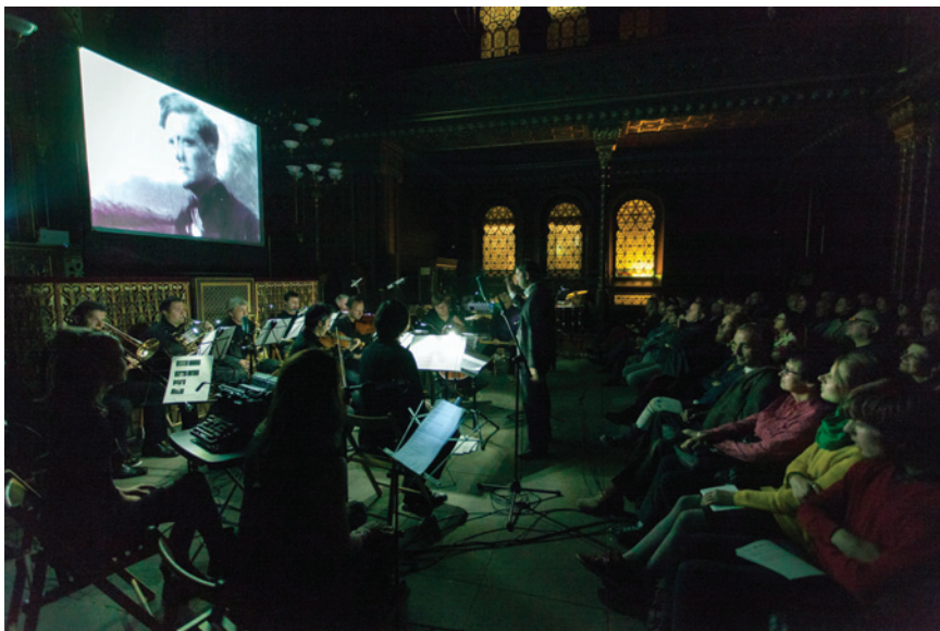
Oba večery bylo zcela plno

Letos uvedené filmové tituly jsou pestrou koláží s žánrovým rozpětím od (proto)dokumentu (Paul Strand) přes abstraktní kinematickou montáž (Ralph Steiner) až po surrealistickou hru se sny (Man Ray). Promítání restaurovaných a digitalizovaných snímků doprovodila nová hudba z dílny mladých českých skladatelů v nastudování a provedení Orchestru BERG pod vedením dirigenta a uměleckého šéfa souboru Petera Vrábela.