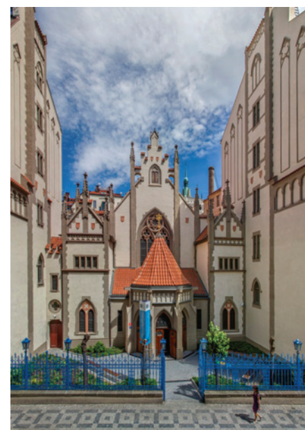
Maiselova synagoga – pohled na západní průčelí