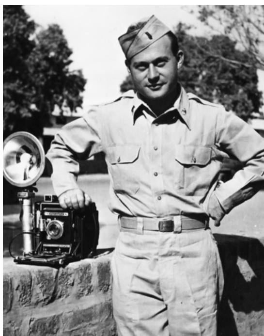
Americký fotožurnalista Arthur Rothstein.

Od května do září 2016 bude Galerie Roberta Guttmanna patřit výstavě Trosečníky v Šanghaji: Ghetto Hongkew objektivem Arthura Rothsteina . Vstup do ghetta ve čtvrti Hongkew, ubikace v ulici Chaoufoong, žena odnášející příděl jídla z distribuční centrály UNRRA, děti bez státní příslušnosti narozené v Číně v rodinách židovských uprchlíků, pouliční šachová partie, improvizovaná kuchyně pod širým nebem na jednom z vnitřních dvorků, polévka s macesovými knedlíčky připravovaná v tradičním čínském kotlíku, vývěska s oznámením o vystěhování, třídění pošty, skupina lidí pročitajících čerstvě vyvěšené seznamy přeživších z koncentračních táborů v Evropě... Toto jsou situace, které zachytil na svých snímcích v dubnu 1946 americký dokumentarista Arthur Rothstein (1915–1985).