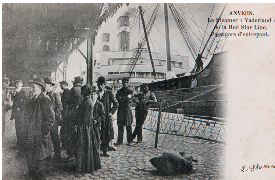
ANVERS. Le Steamer « Vaderland » de la Red Star Line. Passagers d'entrepont.

Tento exodus zachytil v antverpském přístavu malíř Eugeen Van Mieghem (1875–1930), který se zde narodil a prožil zde celý svůj život. Od mládí se setkával s barvitým světem