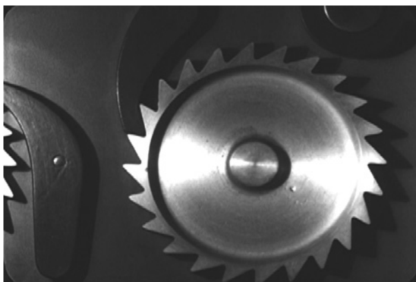
Záběr z filmu Mechanické principy Ralpha Steinera

Ve dnech 12.–13. října jsme ve Španělské synagoze již posedmé přivítali fanoušky cyklu CINEGOGA, unikátní syntézy němému filmu, živé hudby a historické architektury. Letošní ročník pod názvem Poetická avantgarda: Mezi Waltem Whitmanem a Robertem Desnosem představil divákům sérii pěti krátkometrážních snímků z dílny amerických židovských tvůrců Paula Stranda (1890–1976), Ralpha Steinera (1899–1986) a Mana Raye (1890–1976), etablovaných fotografů se zájmem o filmový experiment.