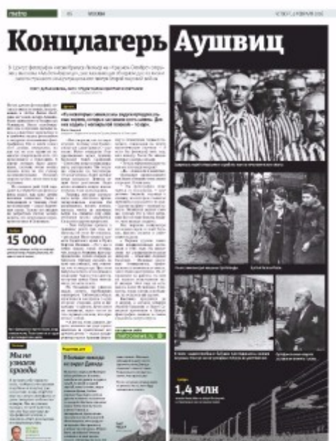
Článek o výstavě v moskevském vydání deníku Metro