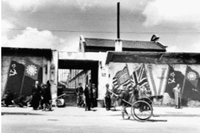
Vstup do tábora Hongkew

Výstava Trosečníky v Šanghaji: Ghetto Hongkew očima uprchlíků a objektivem Arthura Rothsteina si klade za cíl na pozadí Rothsteinovy fotoreportáže přiblížit osud československých občanů, kteří tvořili v Šanghaji sice nepočetnou, ale zdaleka nikoli bezvýznamnou skupinu (na základě různých seznamů z let 1942-1946 lze odhadovat, že československou obec v Šanghaji tvořilo zhruba 300-400 osob, z nichž asi tři čtvrtiny byli Židé).