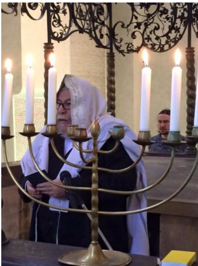
Vrchní zemský rabín Karol Sidon