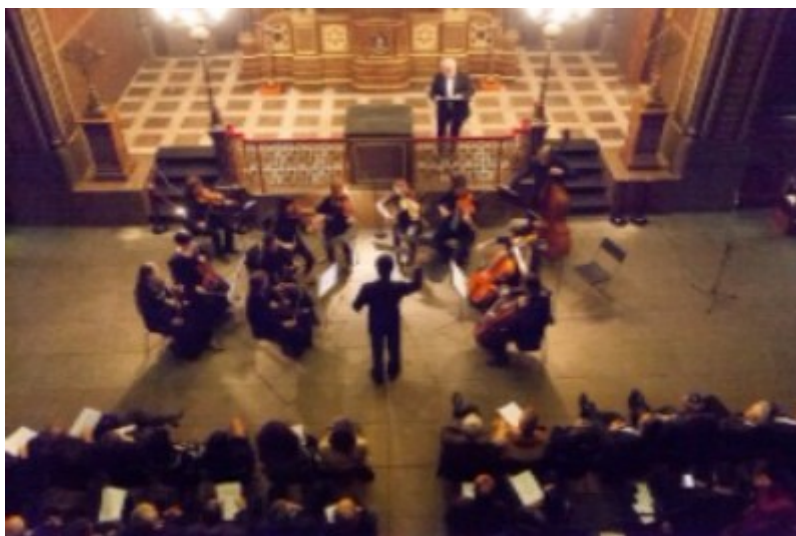
Slavnostní koncert ve Španělské synagoze