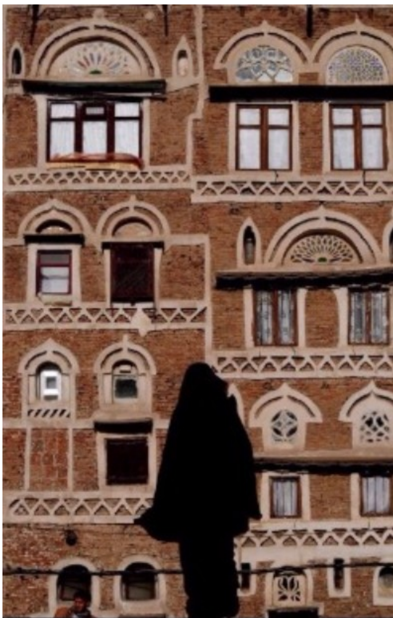
Fotografie z výstavy Starobylá židovská komunita v Jemenu

V Maiselově synagoze proběhly v lednu dva výjimečné koncerty. První z nich, Salamone Rossi Hebreo e il suo tempo , byl zaměřen na dílo italského