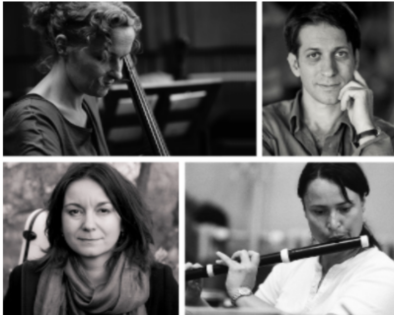
Soubor For Several Friends