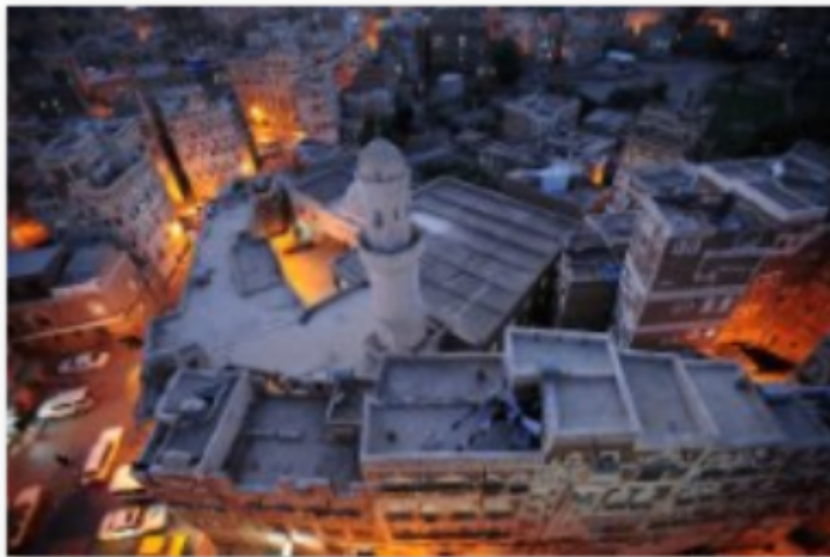
Fotografie z výstavy Starobylá židovská komunita v Jemenu