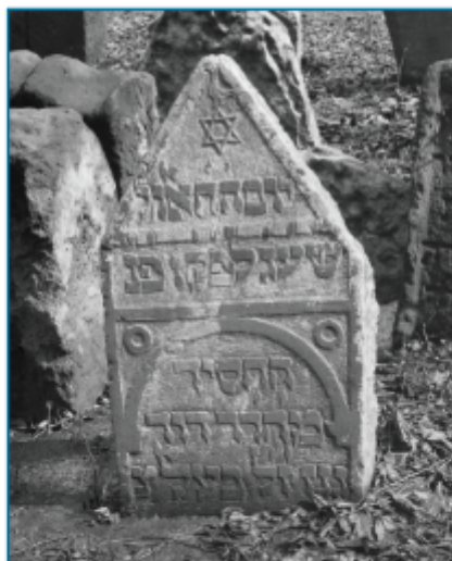
David Gans (1541–1613): A Reconsideration