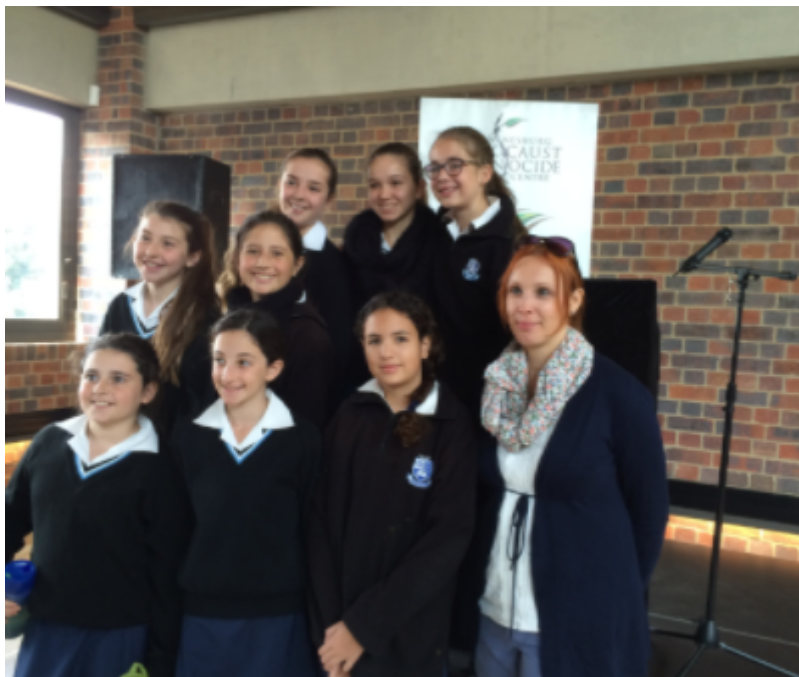
Jewish Daily School (Grade 6) Johannesburg.

Podrobnosti o přednáškách a fotogalerii naleznete na stránce http://www.mzv.cz/pretoria/cz/kultura_a_skolstvi/kultura/o_uspesne_misi_zuzany_pavlovske_po_jizni.html