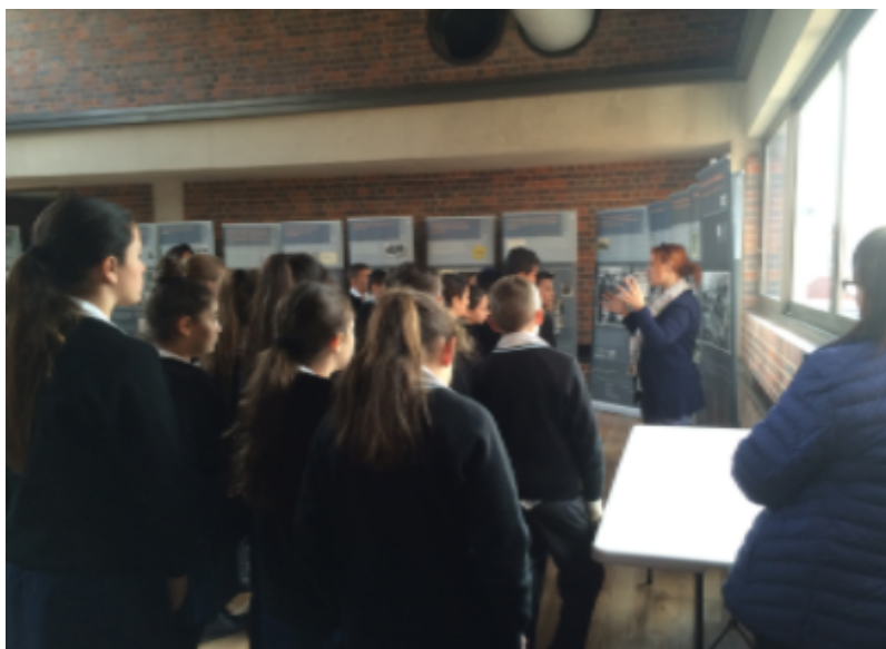
Jewish Daily School (Grade 6) Johannesburg.