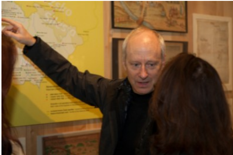
Michael J. Sandel

Profesor politické filozofie na University of Harvard Michael J. Sandel navštívil muzeum 19. dubna 2016.