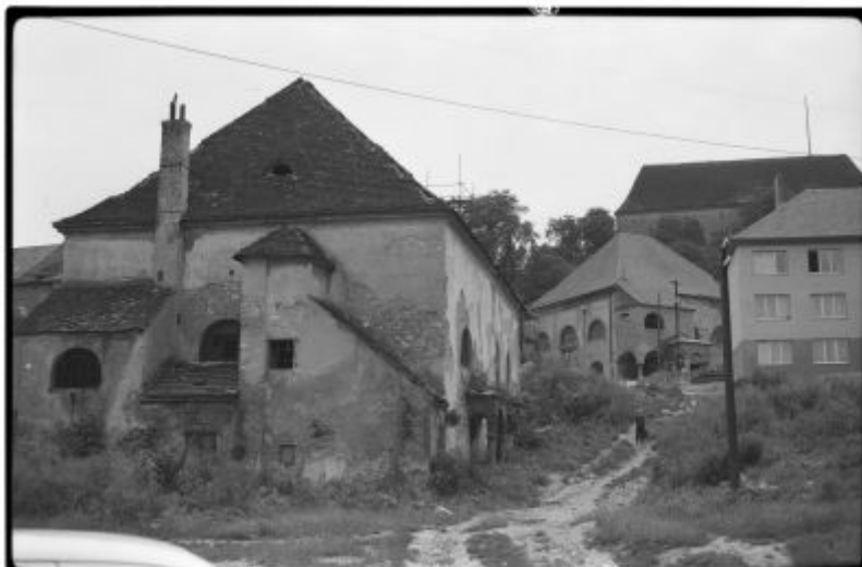
Dolní a Horní synagoga v Mikulově v roce 1966

Kromě velkého množství fotografií českých i slovenských židovských památek - hřbitovů, synagog či židovských škol - kolekce obsahuje i fotografie, které s židovskou tematikou nesouvisí (kostely, kapličky, boží muka a další významné památky). Fotografické dílo Jiřího Fiedlera je tak hodnotným svědectvím o stavu památek i krajiny v historickém vývoji společnosti.