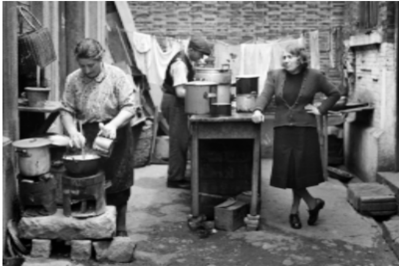
Arthur Rothstein: Společná kuchyně a prádelna na dvorku obytného bloku, duben 1946.

Galerie Roberta Guttmanna, U Staré školy 3, Praha 1.