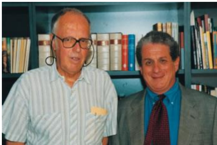
Nadace Survivors of the Shoah, USA

Nakladatelství Portál vydalo za přispění Židovského muzea v Praze pozoruhodný skutečný příběh moravské židovské dívky Hany Bradyové, která zahynula ve vyhlazovacím táboře v Osvětimi. Příběh zrekonstruovala Fumiko Išioka, zakladatelka Tokijského centra pro studium holocaustu, ve kterém se v roce 2000 objevil kufřík Hany Bradyové s nápisem na vrchní straně: Hanna Brady, 16. 5. 1931, sirotek. České vydání je doplněno o úvod napsaný Haniným bratrem Jiřím Bradym, který dnes žije v Kanadě. Kniha je určena učitelům základních škol jako doplněk při výuce dějin a čtenářům memoárové literatury z druhé světové války. Knížku si je možno objednat na adrese Židovského muzea v Praze nebo elektronicky: ✉ sales@jewishmuseum.cz případně přímo na webových stránkách muzea.