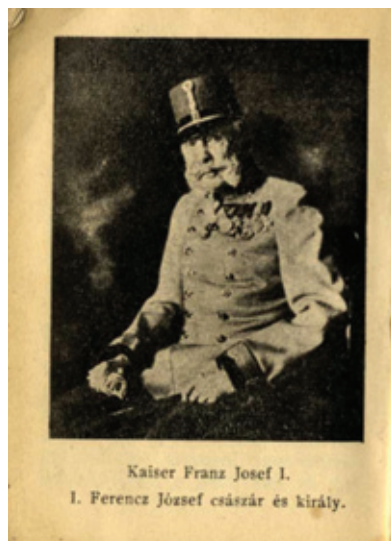
Frankfurter Arnold: Andachtsbüchlein für jüdische Krieger im Felde , Vídeň 1915 (hebrejský originál je doplněn německým a maďarským překladem)