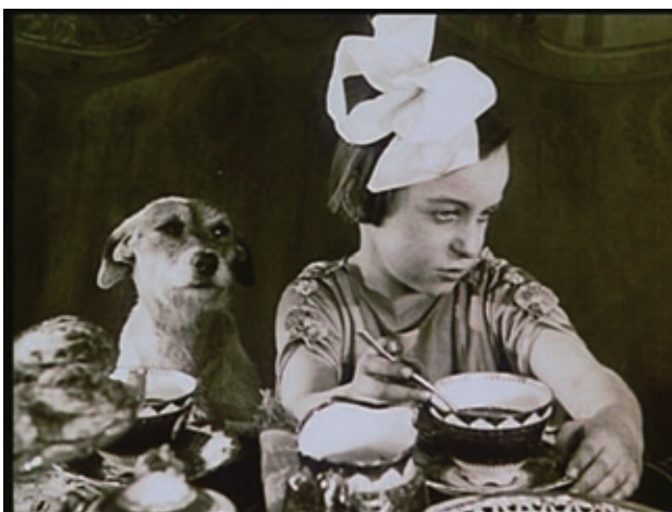
Záběr z filmu Město bez Židů