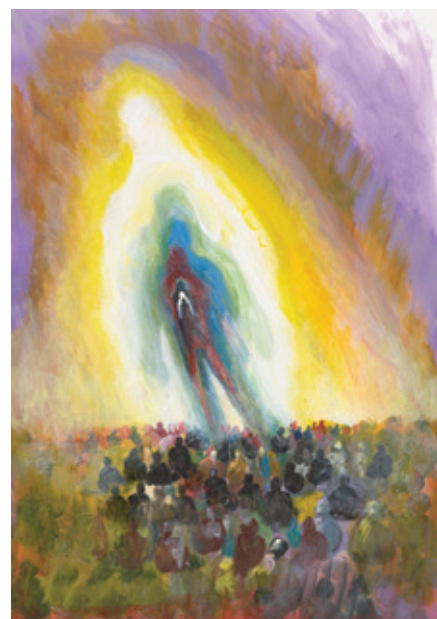
Kresba, na jejímž podkladě vznikl program k představení „Golem 13“