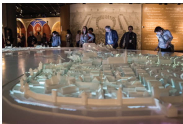
POLIN – nově otevřené varšavské Muzeum historie polských Židů