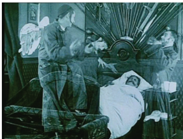
Záběr z filmu Město bez Židů

Novou hudbu k filmu složil skladatel Petr Wajsar na přímou objednávku Orchestru BERG. Toto špičkové těleso již celou řadu let přivádí na českou hudební scénu inovativní, ale zároveň divácky atraktivní projekty kombinující současnou hudbu s tancem, filmem a divadlem.