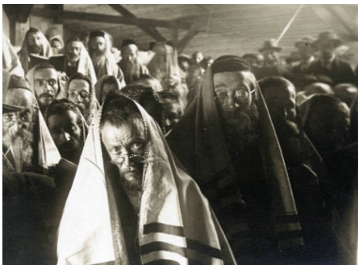
Aranžovaná fotografie židovských uprchlíků v barákovém táboře v Německém (dnes Havlíčkově) Brodu 1915–1917.

Výstava sleduje osudy židovských uprchlíků do českých zemí na pozadí uprchlické politiky státu, vzniku uprchlických táborů a činnosti pomocných organizací. V České republice dosud nezveřejněné fotografie zachycují nejen život uprchlíků, jejich ubytování či uprchlické tábory, ale vypovídají také o fascinaci odlišností „východních Židů“, jejichž oděv, zbožnost a nezvyklý jazyk vyvolávaly značnou pozornost. Vyrovnávání se s odlišností a předsudky vůči židovským uprchlíkům ilustrují namluvené úryvky z dobových kronik a tisku. Reakce na pobyt židovských uprchlíků dokreslují také příklady ze sbírky vizuálního umění Židovského muzea v Praze.