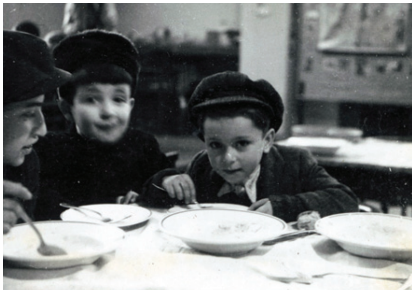
Dětský útulek v Dušní ulici, 1946

s návratem přeživších z koncentračních táborů a tranzitem desetitisíců židovských uprchlíků přes naše území. Tématicky tak naváže na předchozí výstavu Orient v Čechách? Židovští uprchlíci za první světové války, uvádějící 20. století jako éru uprchlíků.