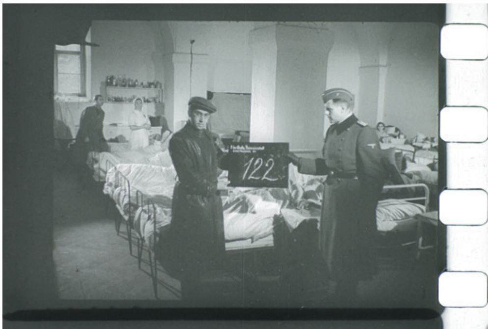
Klapka z terezínského natáčení, 1942

Výstava, jejímiž kurátorkami byly Eva Strusková za NFA a Jana Šplíchalová za ŽMP, byla pro velký zájem návštěvníků prodloužena – za dobu jejího trvání ji zhlédlo více než 13 000 osob. Velké pozornosti se expozice těšila i u našich a zahraničních médií – informovaly o ní např. Česká televize, Český rozhlas, Lidové noviny, Týden, Prager Zeitung, Prague Post a Daily Telegraph.