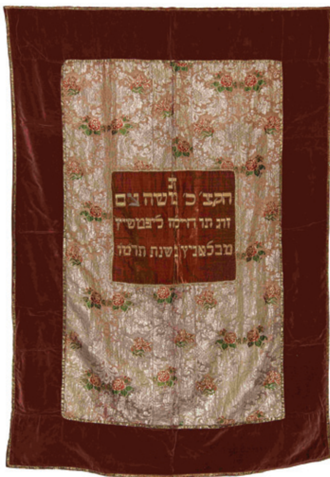
Synagogální opona z Mladé Vožice