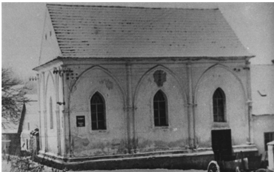
Synagoga v Mladé Vožici, 40. léta 20. století