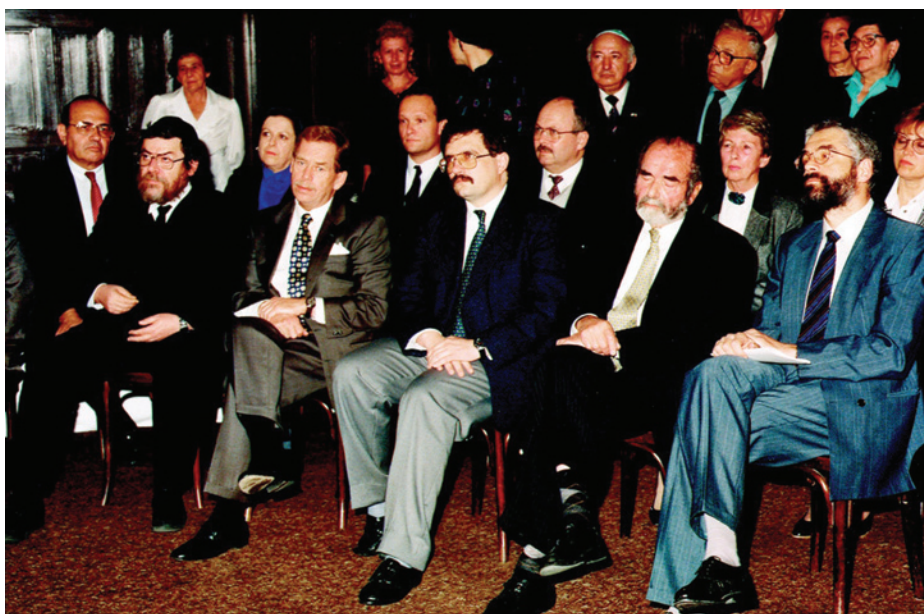
Svědky slavnostního zahájení činnosti muzea byli tehdejší prezident České republiky Václav Havel, místopředseda vlády Josef Lux, ministr kultury Pavel Tigrid a další vysokí představitelé vlády a státu