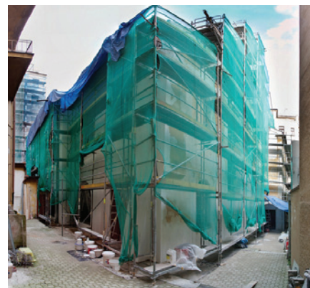
Opravy venkovních fasád Maiselovy synagogy

S dokončením prací a kolaudací stavby se dle harmonogramu výstavby počítá na jaře roku 2015. Následně bude v synagoze pro veřejnost otevřena nová expozice Dějiny Židů v českých zemích od počátků po emancipaci .