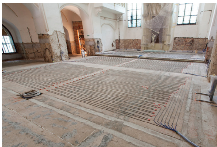
Práce na kabelových rozvodech v podlahách synagogy

V minulém vydání muzejního Zpravodaje jsme podrobně informovali o zahájení rekonstrukce v květnu 2014. Realizační práce probíhají v souladu s harmonogramem. V srpnu byly dokončeny veškeré kabelové rozvody v podlahových trasách včetně osazení zámečnických konstrukcí pro vitríny a audiovizuální prvky. Během září byly položeny