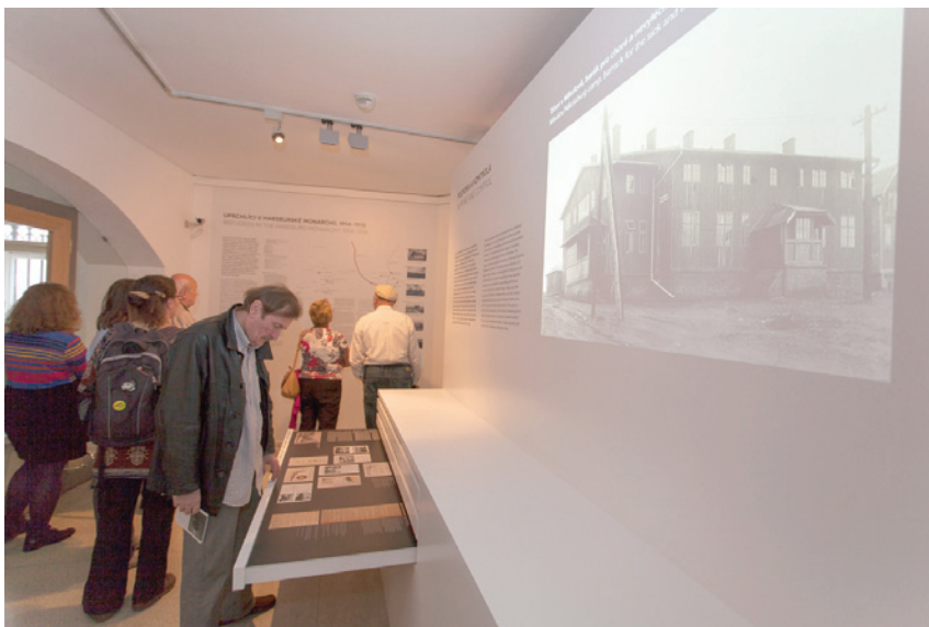
Vernisáž výstavy Orient v Čechách? Židovští uprchlíci za první světové války se konala 27. srpna 2014

Autory výstavy jsou Michal Frankl, Jan Wittenberg a Wolfgang Schellenbacher.