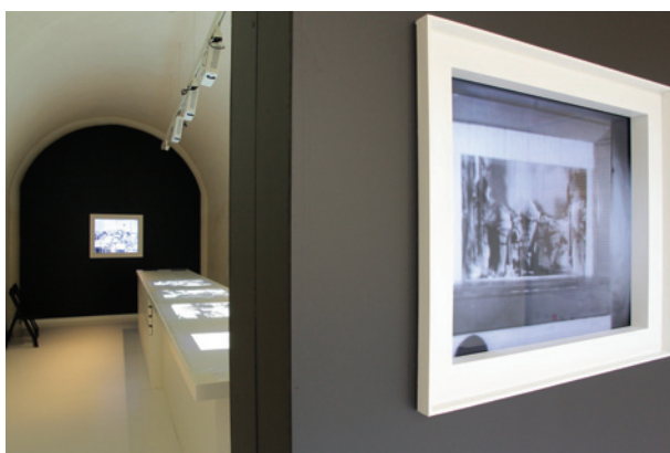
Výstavu Pravda a lež. Filmování v ghettu Terezín 1942–1945 můžete navštívit v Památníku Terezín