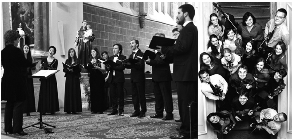
Písně z ticha zazněly v podání The Hope Gospel Singers, vokální skupiny VOX a komorního orchestru ZOE Bratislava.