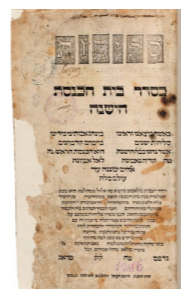
Elegie Et kol ha-tela'a (Všechna ta protivenství) ve spisu Slichot ke-seder bejt ha-kneset ha-ješana , Praha 1605

Tato publikace byla vydána s přispěním Ministerstva kultury České republiky Židovské muzeum v Praze, Oddělení pro vzdělávání a kulturu Židovského muzea v Praze Maiselova 15, 110 00 Praha, education@jewishmuseum.cz, tel: 222 749 350