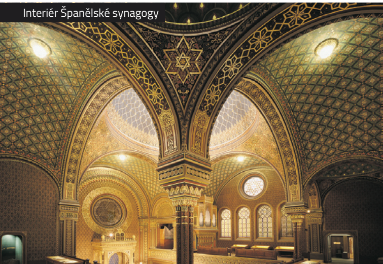
Interiér Španělské synagogy

| Dovolujeme si upozornit, že Staronová synagoga není součástí muzea, k její návštěvě je proto nutné zakoupit zvláštní vstupenku.