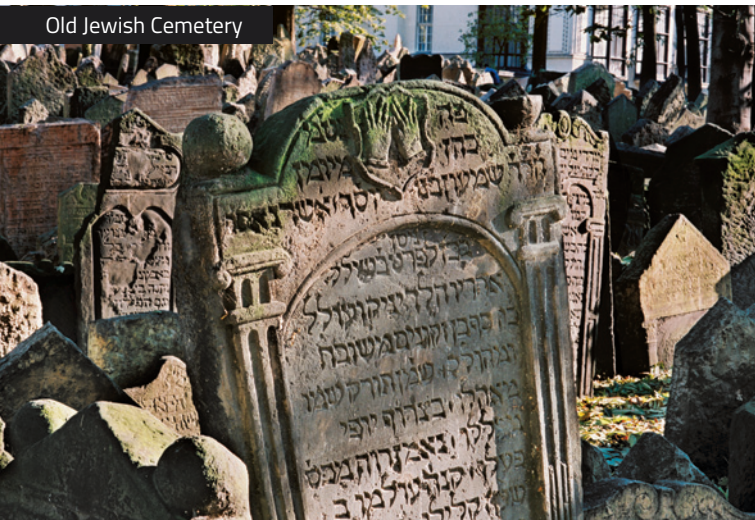
Old Jewish Cemetery

The Old-New Synagogue is not part of the Jewish Museum. A separate ticket must be purchased to visit this site.