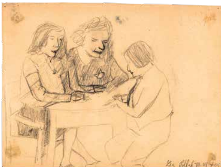
■ Lea Lenka Pollak (1930–1944), VYUČOVÁNÍ V DÍVČÍM DOMOVĚ , grafitová tužka na papíře