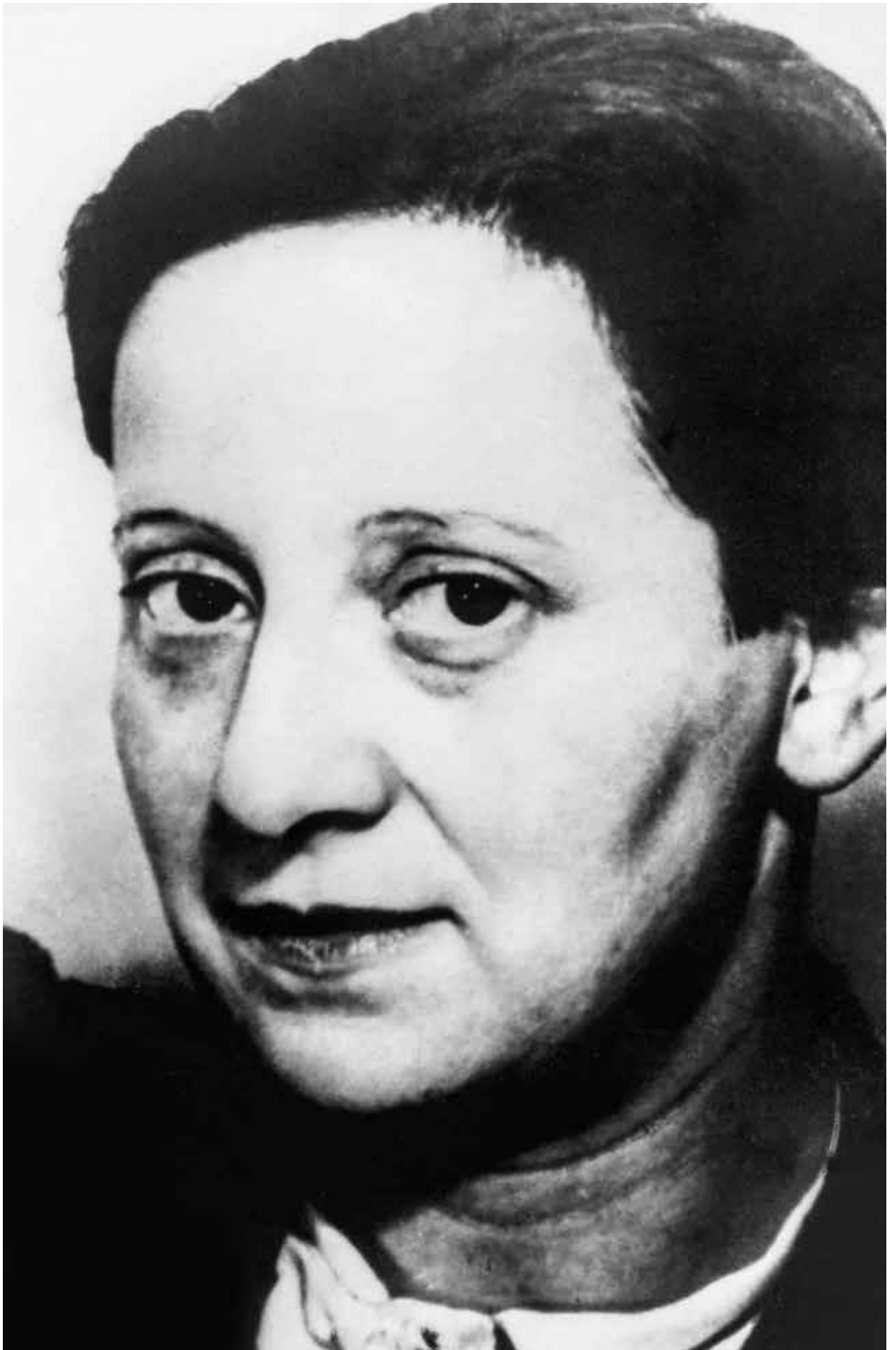
■ Hannes Beckmann: PORTRÉT FRIEDL DICKER , 1935