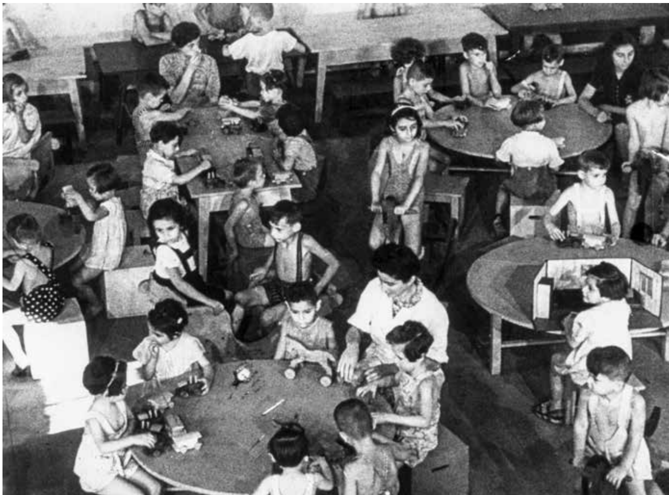
■ Děti v improvizované „terezínské školce“. Záběr z nacistického propagandistického snímku známého pod neoficiálním názvem HITLER DAROVAL ŽIDŮM MĚSTO , 1944

ghetta tvůrčí aktivity za součást vzdělávání považovány nebyly. Dětské kreslení nebo divadlo byly pro nacisty jen způsob zábavy a organizace neukázněných dětí. A v tom byla právě genialita Friedl Dicker-Brandeis, učitelky, která s hodinami kreslení v ghettu začala. Pochopila, že výtvarné vzdělávání může použít jako náhradu klasické školní výuky a že tím navíc může pokrýt i další potřeby dětí v internaci, které kromě materiálního nedostatku trpěly také nedostatkem kvalitního sociálního kontaktu a hlubších emočních vazeb, což se jim snažila nahradit.