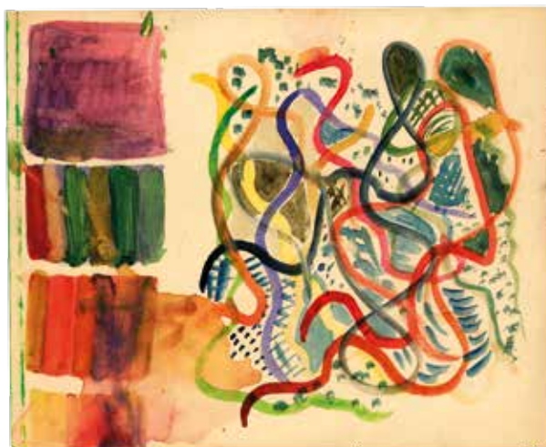
■ Neznámý dětský autor, BAREVNÁ KOMPOZICE , akvarel na útržku balicího papíru