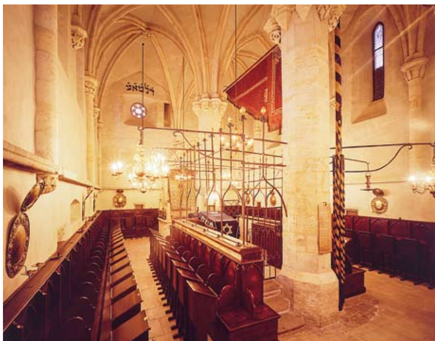
■ Sedadla jsou v synagoze rozmístěna po obvodu hlavního sálu.