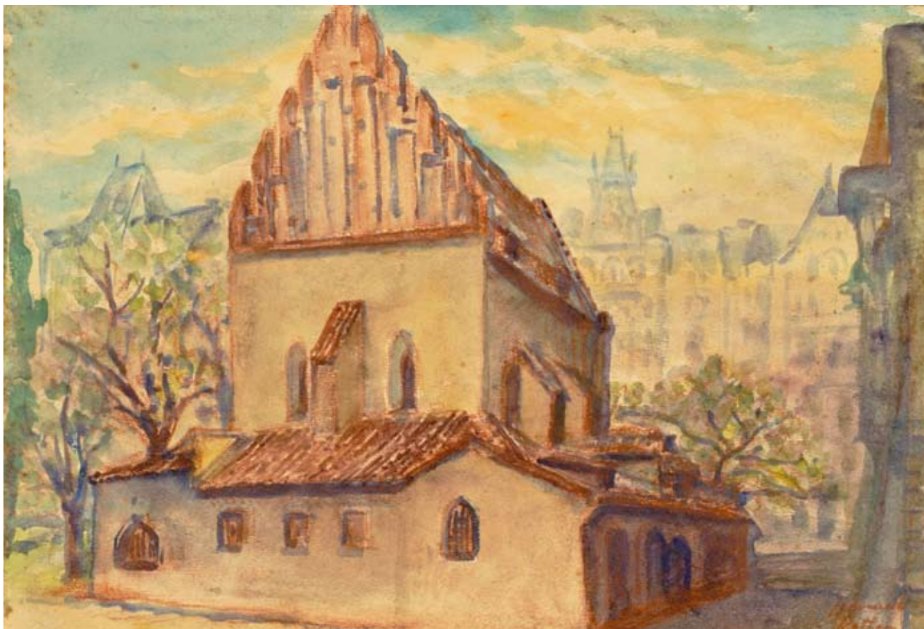
■ Západní průčelí Staronové synagogy v akvarelu českého výtvarníka Leonarda Rottera

le kostela sv. Ducha na místě, kde nyní stojí Španělská synagoga. Později byla vystavěna další synagoga, která byla také nazvaná Nová škola, a tak se pro tuto synagogu ujal název Stará Nová škola (Alt-Neuschul).