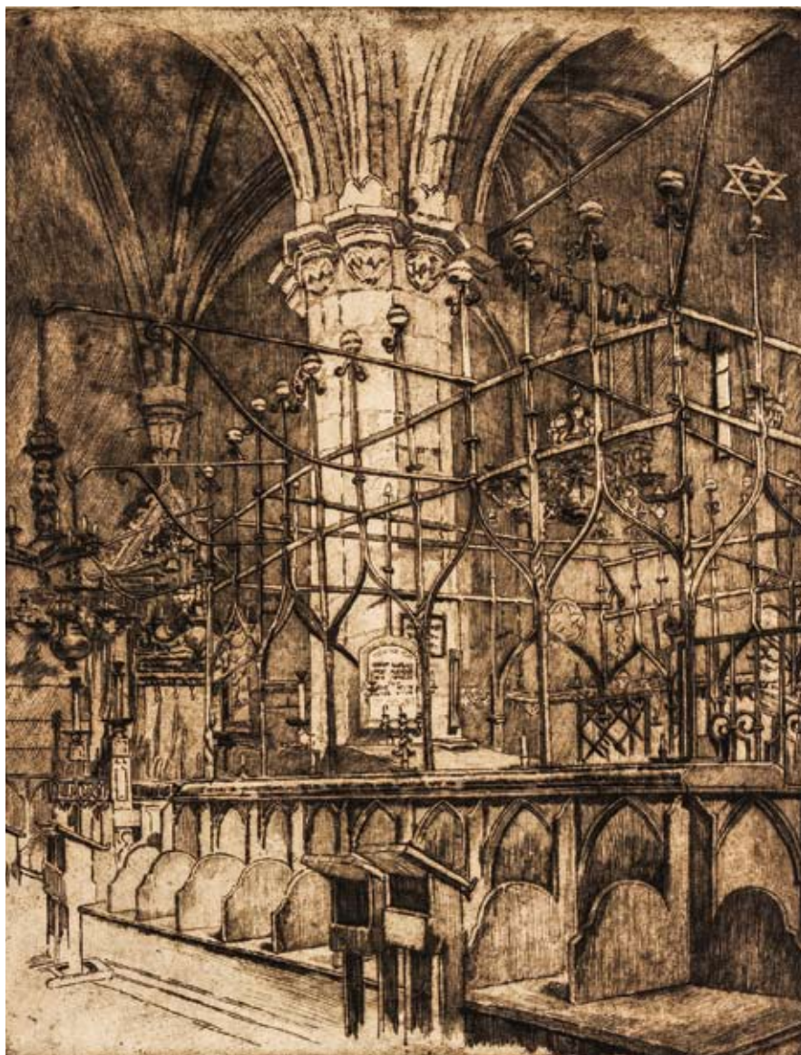
■ Pohled do hlavní lodi Staronové synagogy na grafickém listu Alexandra Jakesche

V čele klenby na východní stěně hlavní lodi jsou vepsány zkratky biblického citátu „Hospodina stále před očima si stavím“ (Žalm 16:8) a talmudického výroku rabbi-