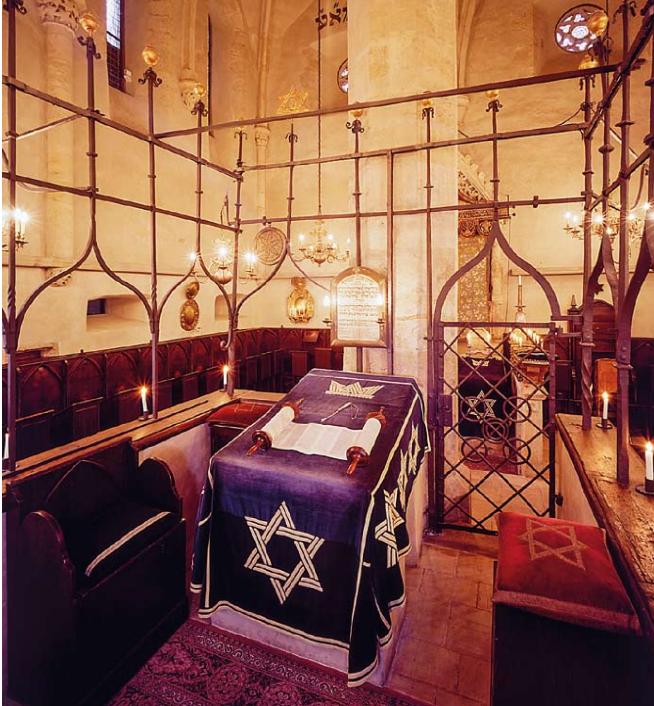
■ Střed hlavního sálu zaujímá vyvýšené pódium s pultem pro předčítání Tóry.

ho Eliezera „věz, před kým stojíš...“, které připomínají věřícím přítomnost Hospodina a napomáhají soustředění k modlitbě. Na protilehlé západní stěně můžeme číst zkratku citátu rabína Joseho z talmudského traktátu Berachot (Požehnání): „Kdo odpovídá amen, je důležitější než ten, kdo žehná.“ Vztahuje se na věřící, kteří nemohou sledovat celou modlitbu, ale stvrzují její obsah svým vyznáním, uvádí se v publikaci Pražské synagogy autora Arno Paříka.