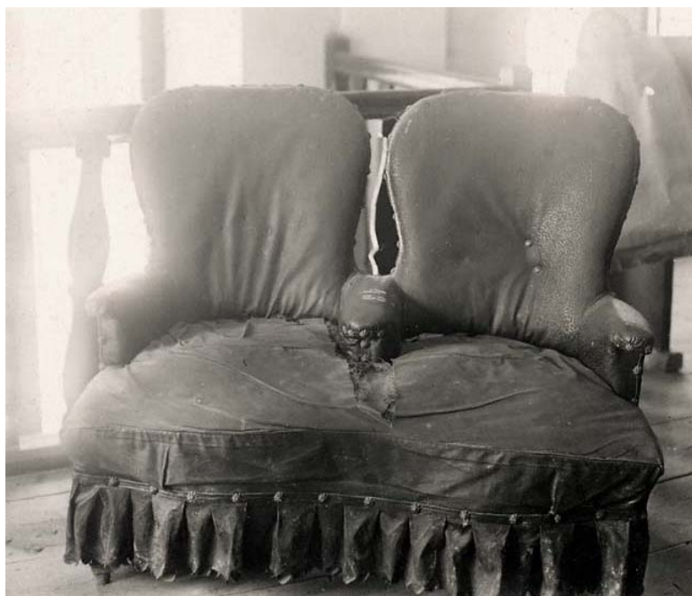
dvojité křeslo z Dambořic, užívané při obřizce (foto kolem r. 1941)