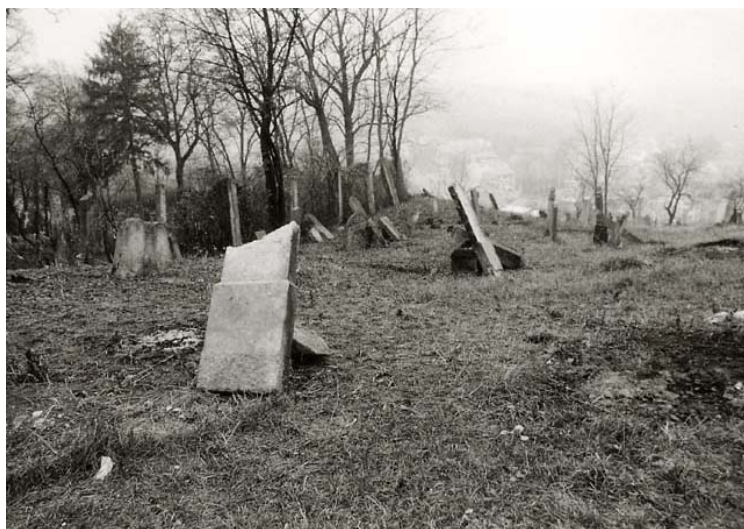
hřbitov (foto r. 1994)