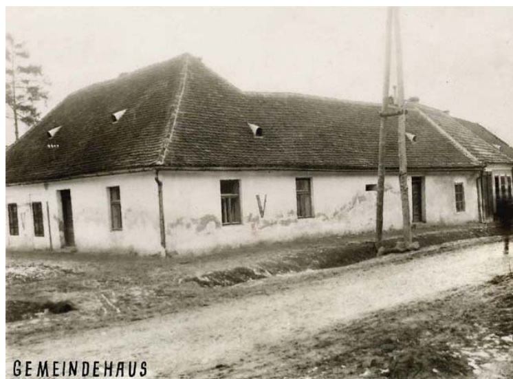
obecní dům židovské obce (foto kolem r. 1941)

1994: dům čp. 393 už neexistuje, přibližně na jeho místě stojí nový obchodní areál (nákupní středisko s vykládací rampou, skladem atd.) ●●Y