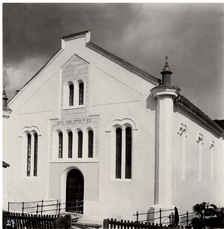
západní (vstupní) průčelí synagogy (foto kolem r. 1941)

1994: na místě synagogy je travnaté a hlinité prostranství (občasné parkoviště) beze stop po budově ●●Y