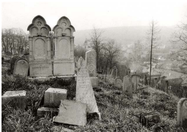
hřbitov (foto r. 1994)