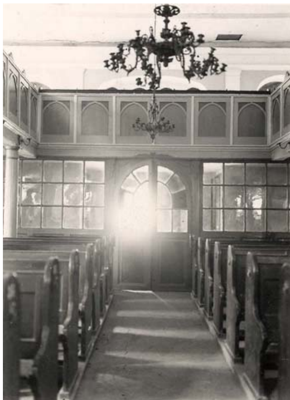
synagoga – západní strana sálu s ženskou galerií (foto kolem r. 1941)