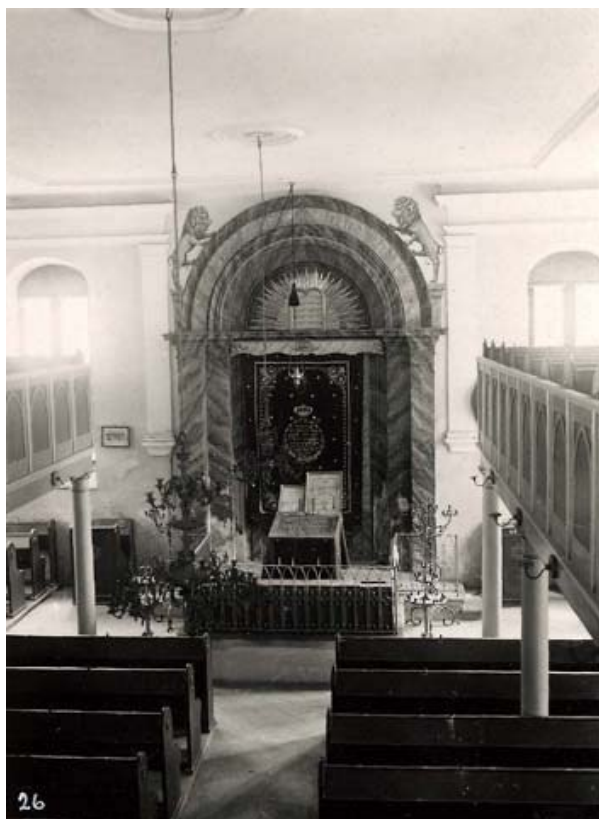
synagoga – východní stěna s aronem ha-kodeš (foto kolem r. 1941)