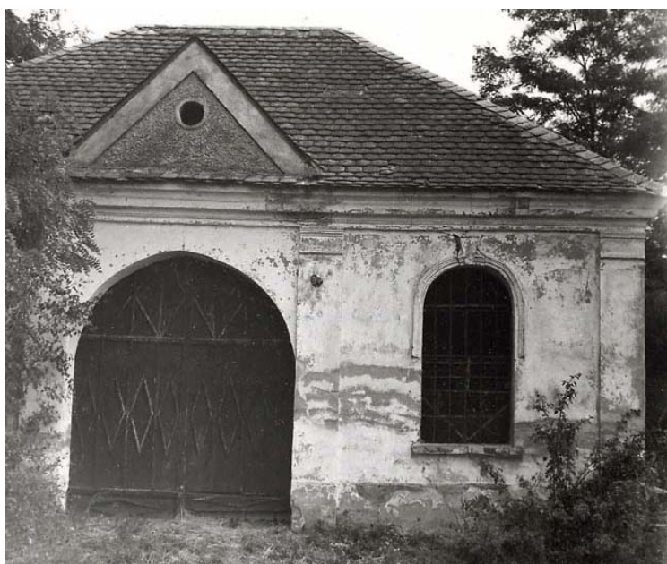
obřadní budova na hřbitově (foto kolem r. 1941)

1994: na místě budovy (a přilehlé jižní, nejstarší části hřbitova) je smetiště: skládka suchých věnců, květin a odpadu z komunálního hřbitova ●●Y