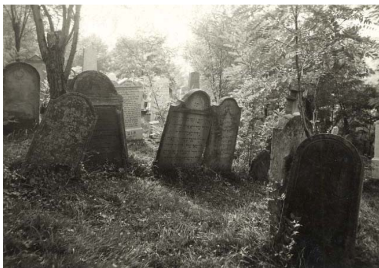
hřbitov (foto kolem r. 1941)

2000: dochováno je asi 400 náhrobků, nejstarší z roku 1700 ●●KZP