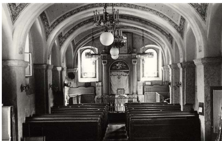
nová synagoga – pohled k východní stěně (foto kolem r. 1941)