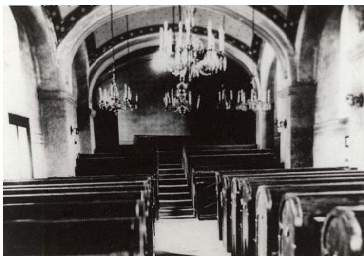
nová synagoga – západní strana sálu s vyvýšeným oddělením pro ženy (foto kolem r. 1941)