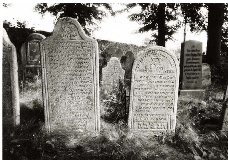
nový hřbitov – náhrobky s datem 1888 (foto r. 1997)