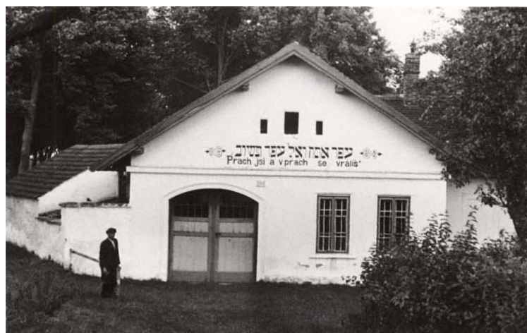
obřadní budova na novém hřbitově (foto kolem r. 1941)