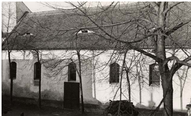
nová synagoga – jižní průčelí (foto kolem r. 1941)