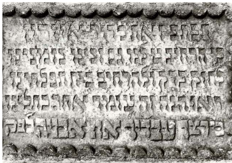
pamětní deska z roku 1820-21, připomínající zvětšení synagogy a původně zasazená v její stěně, dnes umístěná na novém hřbitově (foto kolem r. 1980)

1868: vyhořela, po požáru byla obnovena „do dnešní podoby“ •• *