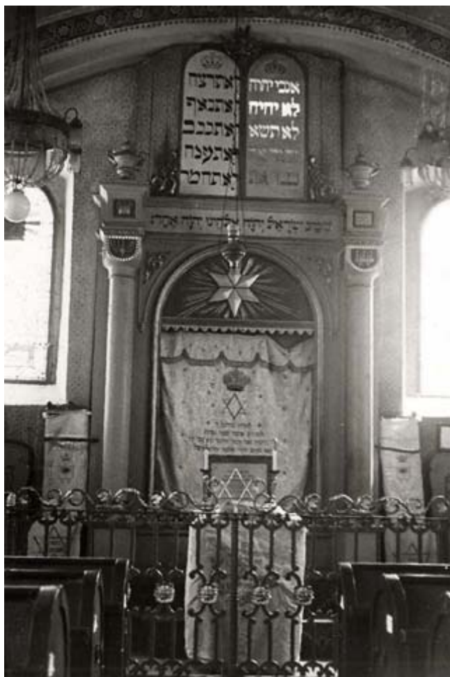
nová synagoga – aron ha-kodeš zakrytý oponou (foto kolem r. 1941)