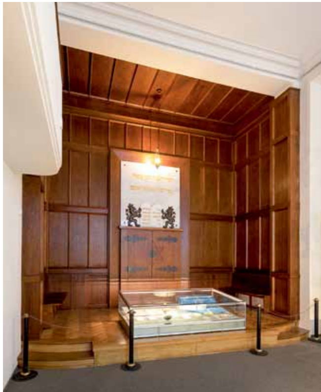
Zimní synagoga. Vytápění velkého historického prostoru bylo náročné a drahé, a tak k stávající synagoze byla po téměř 70 letech přistavěna další budova s menší zimní synagogou. Dnes je v ní expozice o pronásledování Židů za komunistického režimu.