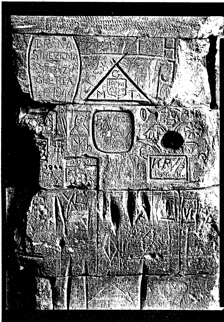
Poslední zprávy z ghetta. Richard Homola fotografuje nápisy v Terezíně. Zajímají ho osudy těch, kteří zanechali vzkazy na terezínských zdech.

Dá se to samozřejmě udělat digitálně, ale to bude jen informace. Na černobílém snímku je nejen dokonalý záznam, ale i něco navíc. Když se díváte na detaily nápisů, máte pocit, že jsou jako jizvy na kůži.