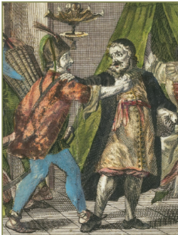
JEWISH MUSEUM IN PRAGUE 2017