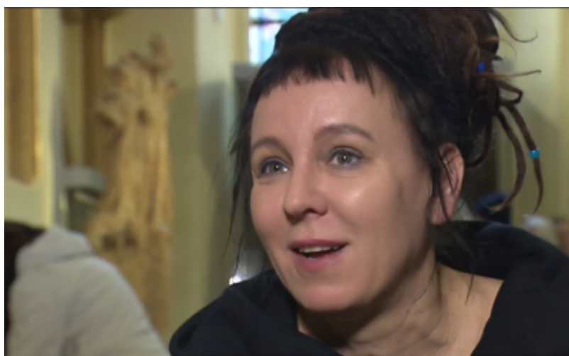
Spisovatelka Olga Tokarczuk v Maiselově synagoze