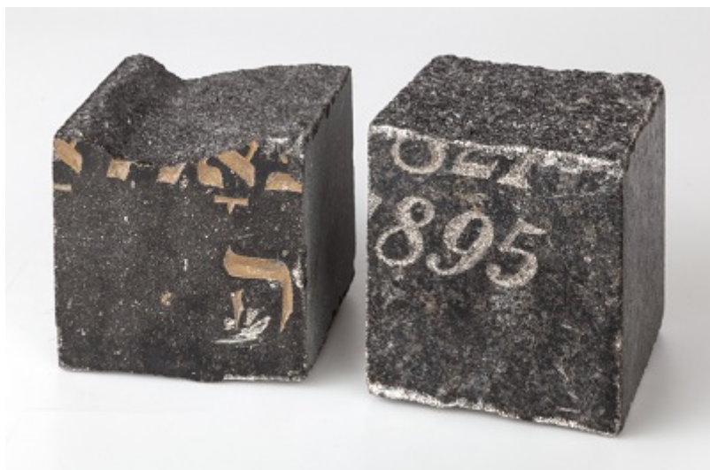
Dlažební kostky vyrobené z židovských náhrobků byly využity při budování pěší zóny na Praze 1.