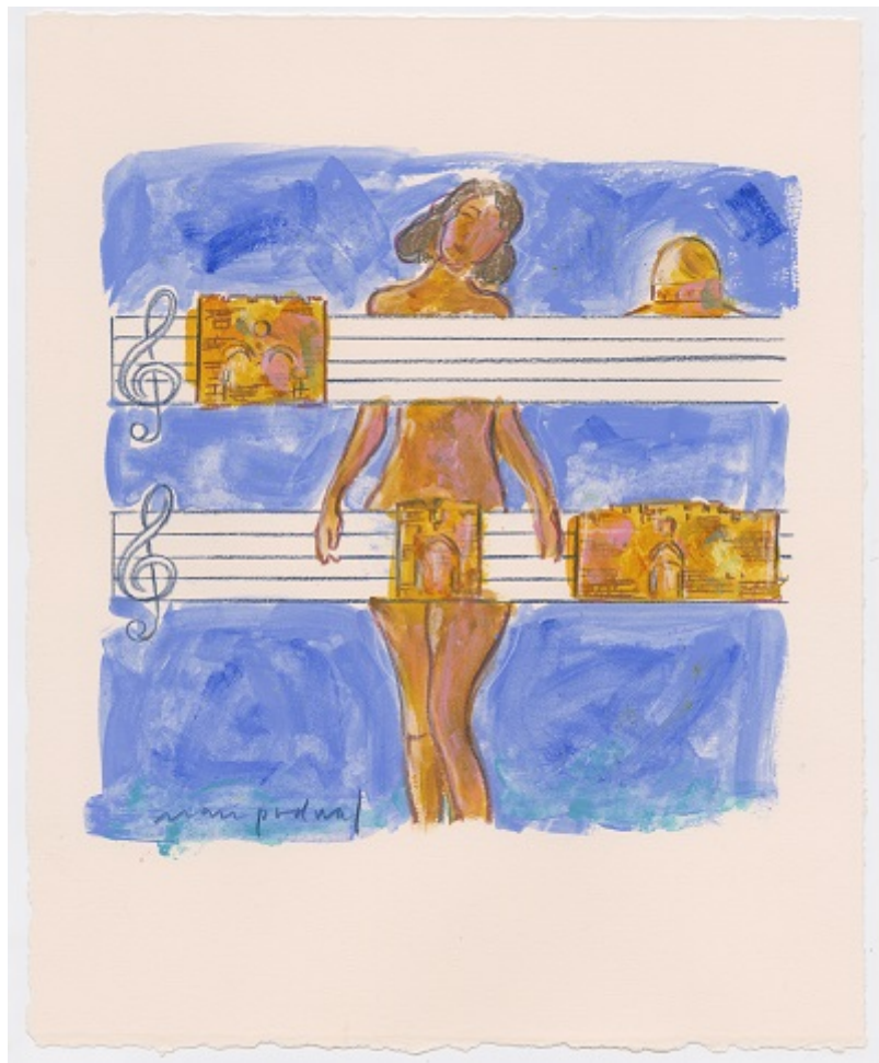
Mark Podwal – Píseň písní / Song of Songs (5:7) , 2016. © Mark Podwal