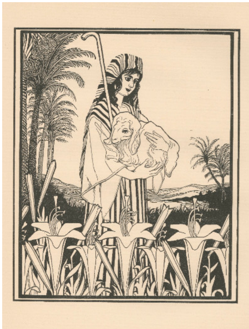
Die Bücher der Bibel – Die Liederichtung , Berlin & Wien 1923. Grafická úprava a ilustrace Ephraim Moses Lilien.

ST 21. 12. v 15 hod: komentovaná prohlídka výstavy „Pojd', milý můj ...“ – Ilustrace k Písní písní v doprovodu kurátora Michala Buška. Základní vstupné 40 Kč.