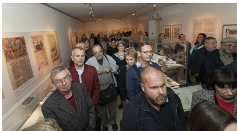
Návštěvníci vernisáže Písně písní