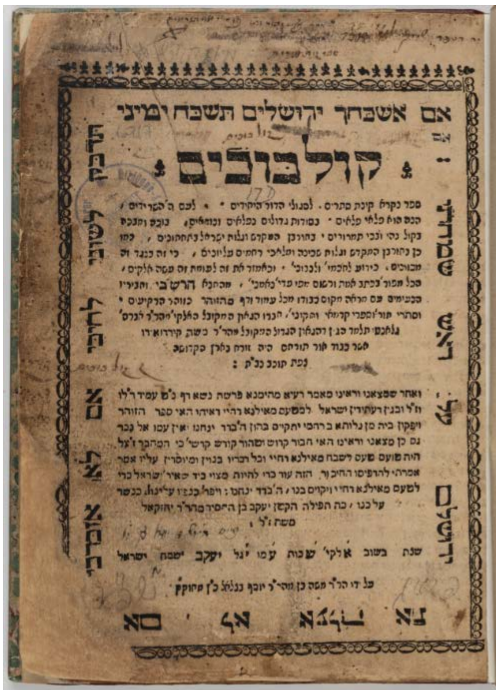
Titulní list Abraham Galante: Kol bochim . (Praha 1621)