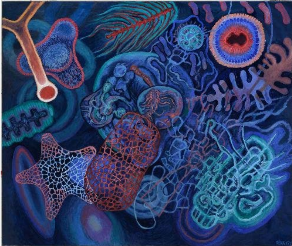
Plankton, olej na plátně, 2015

Galerie Roberta Guttmanna, U Staré školy 3, Praha 1 Otevřeno denně kromě sobot a dalších židovských svátků v zimním čase 9-16.30 hod., v letním čase 9-18 hod.