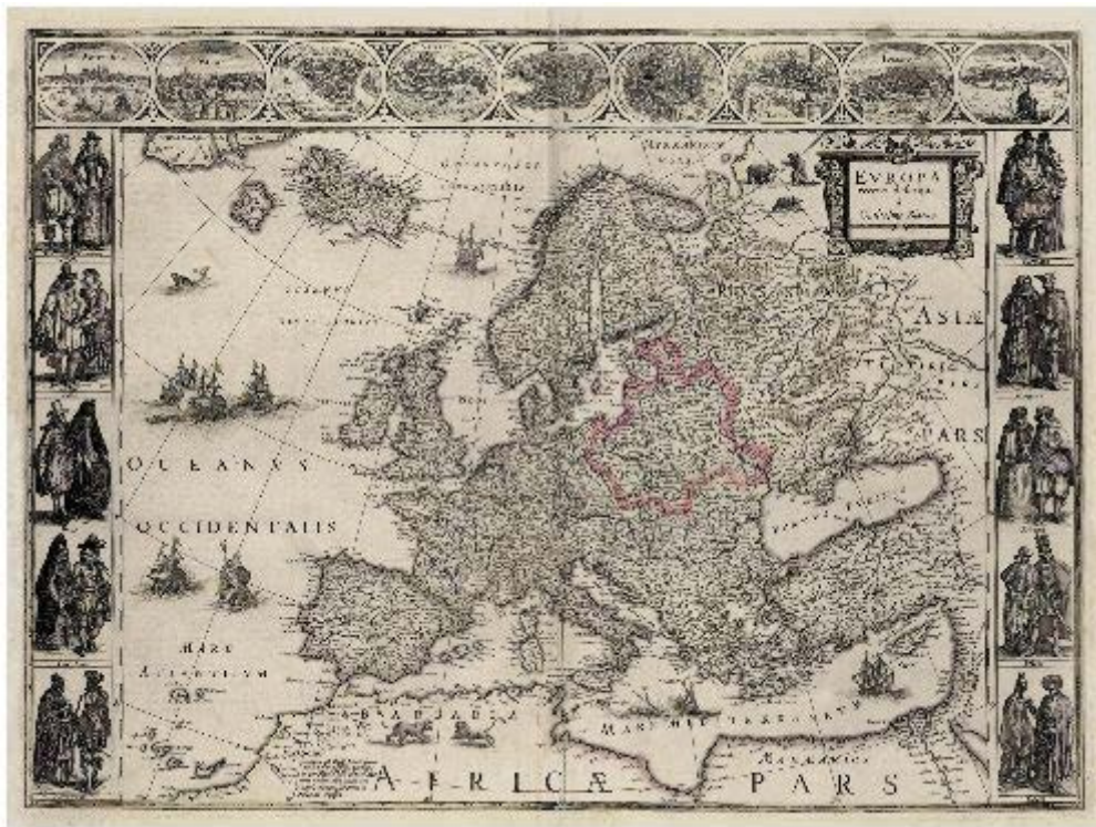
Mapa Evropy, 1617. Území Rzeczpospolité je barevně zvýrazněno.