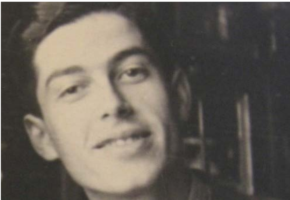
Hudební skladatel Gideon Klein (1919–1945).