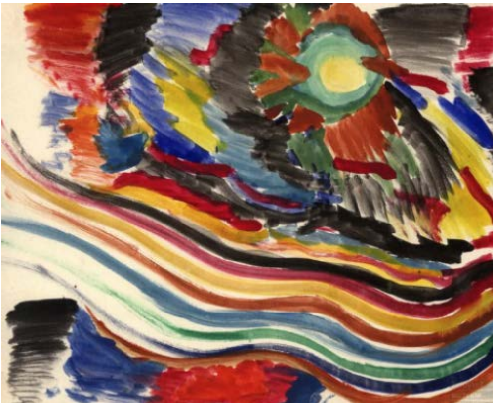
Abstraktní barevná kompozice, autor neznámý, Terezín 1943-44.