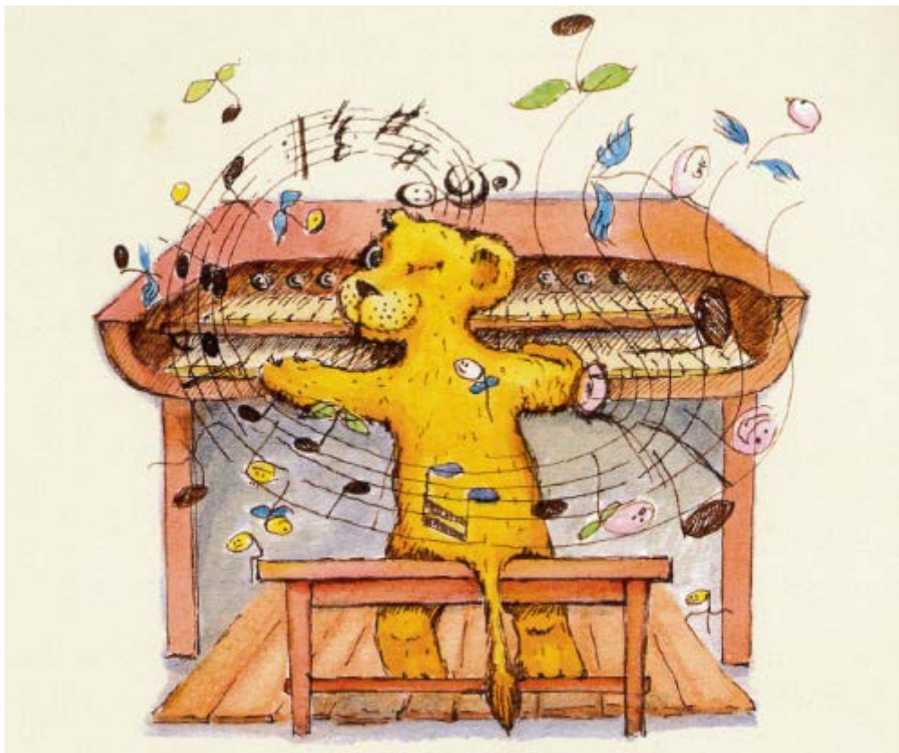
Lvíček Arje vás zve na nedělní dílnu pro děti. Ilustrace (c) Hana Klímová