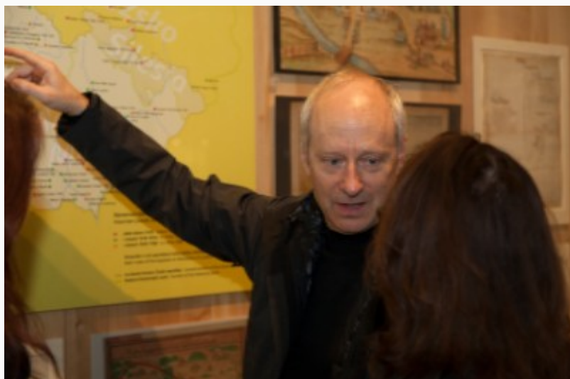
Michael J. Sandel

Profesor politické filozofie na University of Harvard Michael J. Sandel navštívil muzeum 19. dubna 2016.