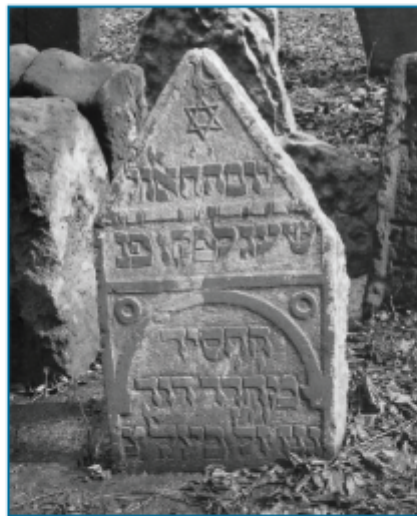
David Gans (1541–1613): A Reconsideration