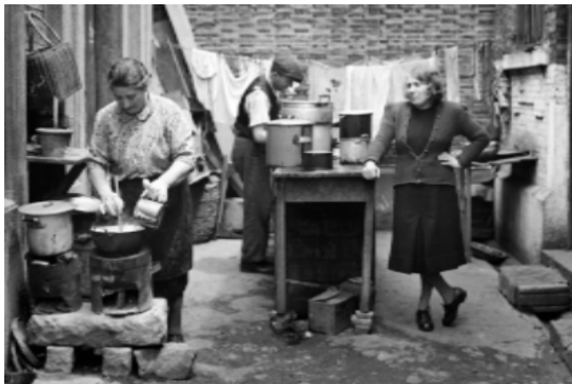
Arthur Rothstein: Společná kuchyně a prádelna na dvorku obytného bloku, duben 1946. (c) Arthur Rothstein Archive

Galerie Roberta Guttmanna, U Staré školy 3, Praha 1.