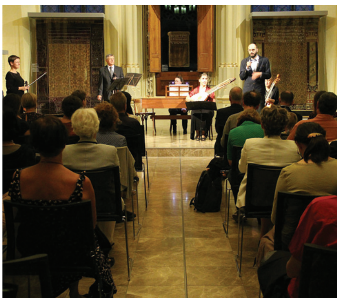
Zahajovací koncert v Maiselově synagoze