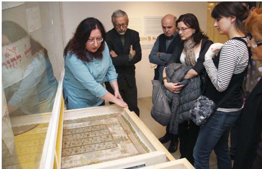
Z komentované prohlídky výstavy v Galerii Roberta Guttmana pro členy Společnosti přátel.