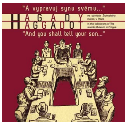
Titulní stránka katalogu k výstavě „A vypravuj synu svému...“, který lze zakoupit v muzejních obchodech nebo objednat na internetových stránkách muzea www.jewish-museum.cz/shop/czshop.php .

of the eighteenth century. Among the oldest editions are the Venice Haggadah (1599) and the Amsterdam Haggadah (1695); the oldest editions from Bohemia on display are the Brno Haggadah (1757) and the Prague Haggadah (1763). These editions in particular are a must see for viewers.