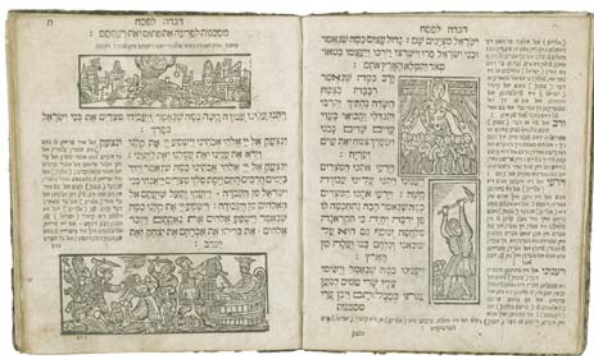
Seder Hagada šel Pesach, Praha 1763, zastoupená na nové výstavě v Galerii Roberta Guttmanna.