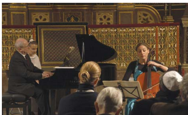
Z lednového koncertu ve Španělské synagoze. From the January concert at the Spanish Synagogue.