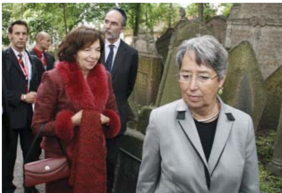
Margit Fischerová v doprovodu Lívie Klausové na Starém židovském hřbitově. Margit Fischer accompanied by Livia Klausová at the Old Jewish Cemetery.

Margit Fischerová, manželka prezidenta Rakouské republiky Heinz Fischeera, v doprovodu Lívie Klausové, manželky českého prezidenta Václava Klause.