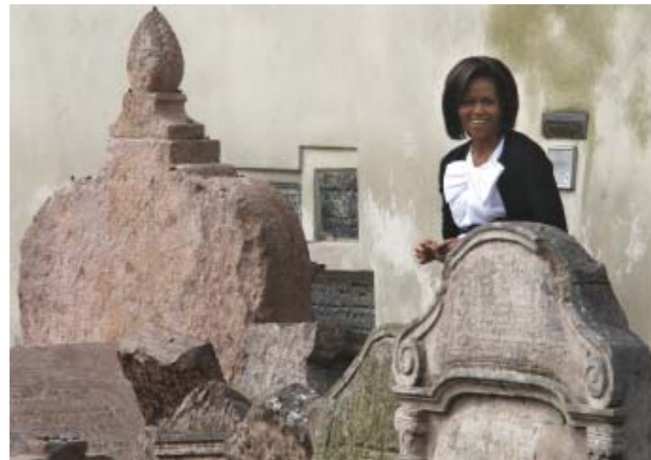
V duchu staré židovské tradice položila první dáma kvittel na hrob rabího Löwa na Starém židovském hřbitově. In keeping with an old Jewish custom, the First Lady placed a kvittel at the grave of Rabbi Loew in the Old Jewish Cemetery.