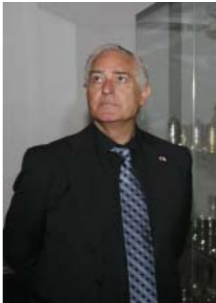
Yitzhak Eldan, izraelský ministr pro veřejnou diplomaci a diasporu. Yitzhak Eldan, Israeli Minister of Public Diplomacy and the Diaspora.

Izraelský ministr pro veřejnou diplomaci a diasporu Yitzhak Eldan.