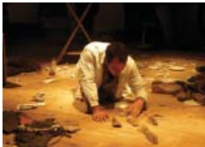
Z divadelního představení v Brně. From the theatre show in Brno.

my of Performing Arts in Brno, deals with the life story of the Nazi war criminal and Auschwitz doctor, Josef Mengele, and the theme of medical and human ethics in extreme life situations. It explores the intoxication of power, the meaningfulness or senselessness of human suffering, and human courage and cowardice. The show met with tremendous response at the Brno centre.