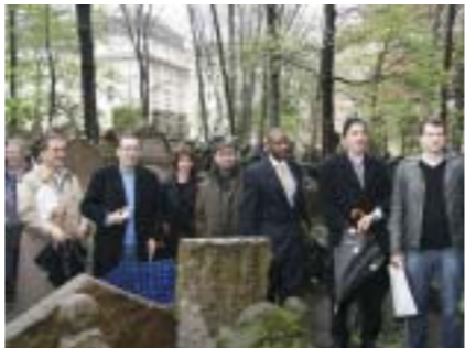
Delegace členů Kongresu Spojených států amerických na Starém židovském hřbitově. Delegation of members of the Congress of the United States of America at the Old Jewish Cemetery.

Delegation of members of the Congress of the United States of America.