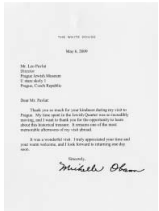
Poděkování za návštěvu, jež zaslala první dáma Spojených států Židovskému muzeu. A letter of thanks to the Jewish Museum from the First Lady.