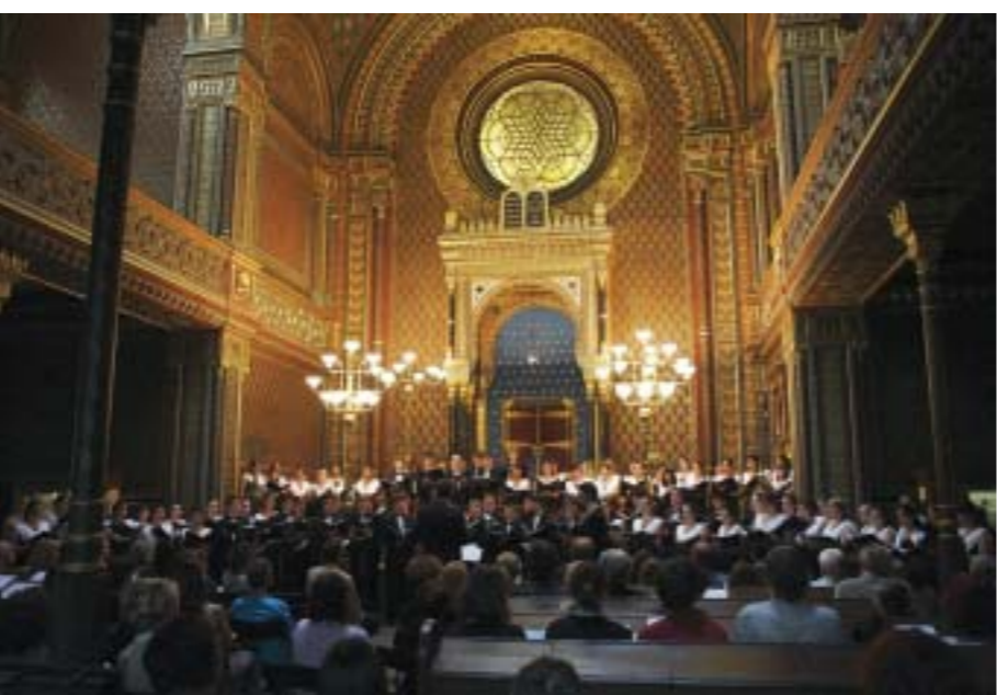
The Gunn High School Choir při koncertě ve Španělské synagoze.

Dne 21. dubna pořádal Institut Terezínské iniciativy a Nadační fond obětem holocaustu vzpomínkovou akci při příležitosti Jom ha-šoa, podle židovského kalendáře Dne vzpomínání na oběti holocaustu. Na náměstí Míru v Praze se tak již počtvrté četla jména obětí nacistické rasové persekuce. Židovské muzeum v Praze bylo part-