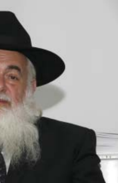
Eliahu Rips ve Vzdělávacím a kulturním centru.

V překladu Pavly Niklové vydalo Židovské muzeum v Praze knihu amerického autora a ilustrátora Marka Podwala Stavěno anděly , která již předtím slavila úspěch ve Spojených státech. Publikace s pomocí kreseb a lyrického textu představuje příběh pražské Altneschul neboli Staronové synagogy, jež je nejstarší dochovanou synagogou v Evropě. Světoznámý židovský spisovatel, myslitel a nositel Nobelovy ceny míru Elie Wiesel v předmluvě knihy napsal: „Autorovy vypravěčské a výtvarné schopnosti zaujmou zvláště dětské čtenáře, a proto je velmi záslužné přiblížit tento příběh také českým dětem v jejich rodném jazyce. Přes všechny