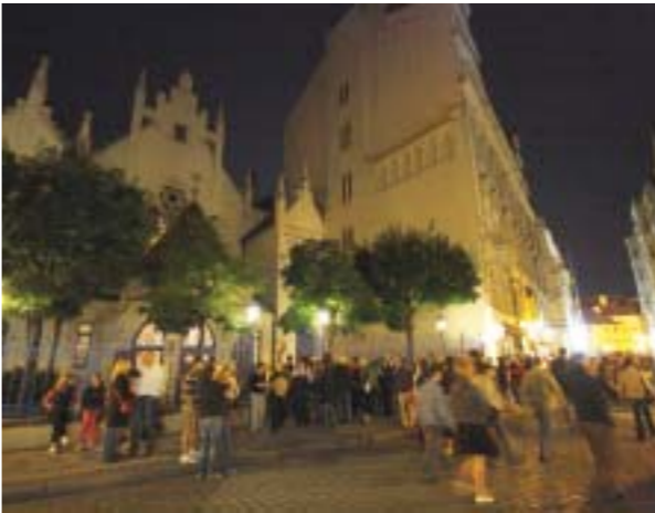
Z Pražské muzejní noci v Židovském muzeu.

As usual, the Jewish Museum took part in the Prague Museum Night, which was held for the sixth time on Saturday 20 June from 7 p.m. to 1 a.m. Twenty-nine museums, galleries and other cultural institutions in Prague provided access free of charge or for a symbolic fee to more than 50 exhibitions. After the Sabbath, the Jewish Museum opened the doors to its permanent exhibition The History of the Jews in