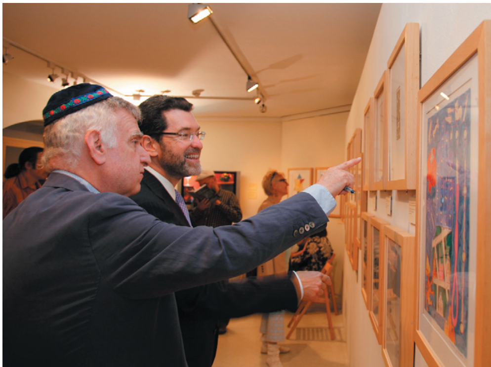
M. Podwal a velvyslanec USA v Praze Norman Eisen během vernisáže výstavy.

Galerie Roberta Guttmanna , U Staré školy 3, Praha 1, otevřeno denně kromě soboty, státních a židovských svátků, a to od 27. 6. do 26. 10 od 9 do 18 hodin a od 28.10. do 11. 11. od 9 do 16.30 hodin.