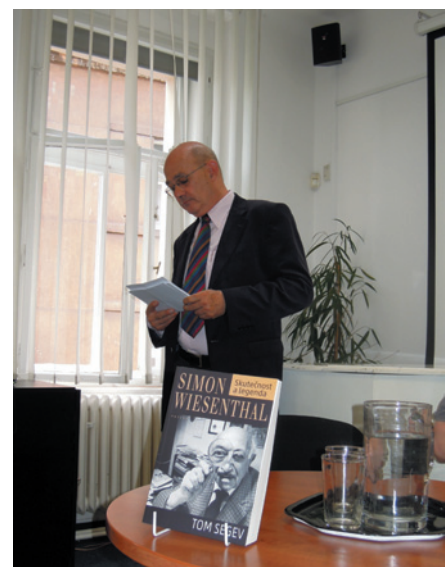
Tom Segev je řazen do generace tzv. „nových“ izraelských historiků.