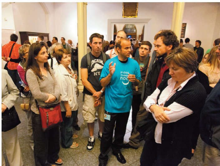
Během muzejní noci byli návštěvníkům k dispozici i naši průvodci.

V sobotu 9. června proběhl již 9. ročník Pražské muzejní noci, jehož se zúčastnilo 39 muzeí, galerií a dalších kulturních institucí. ŽMP při této příležitosti zpřístupnilo expozice v Maiselově a Španělské synagoze. Za necelé tři hodiny navštívilo Maiselovu synagogu, kde probíhal i program pro děti, 1 333 a Španělskou synagogu 1 765 návštěvníků. Všem, kteří k nám zavítali, děkujeme za zájem i za trpělivost při čekání na vstup. A při příštím, 10. ročníku se těšíme opět na shledanou.