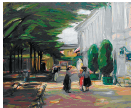
G. Kars, V Hamburku, 1906, olej na plátně, Židovské muzeum v Praze.

Výstavu zhlédlo přes 5 000 samostatně platících návštěvníků (galerii je možno navštívit v rámci vstupenky do všech objektů ŽMP, za zvýhodněné vstupné v kombinaci s prohlídkou Španělské synagogy, ale i samostatně). Z jejich ohlasů je patrné, že naprostou většinu z nich tento v Čechách téměř zapomenutý autor, který je však v zahraničí dodnes považován za jednoho z nejznámějších českých židovských umělců, velmi zaujal a že by uvítali možnost se s jeho dílem znovu setkat.