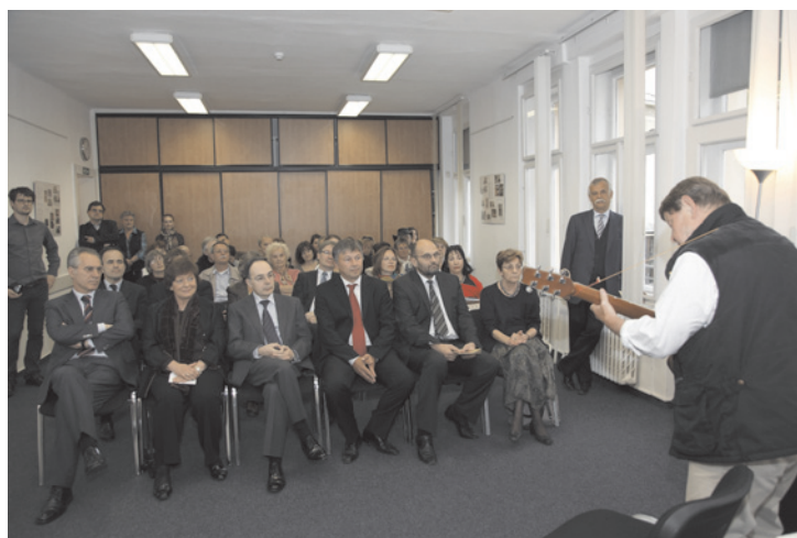
Vernisáže výstavy se zúčastnila i velvyslankyně Belgického království v České republice paní Renilde Loecx (druhá zleva).