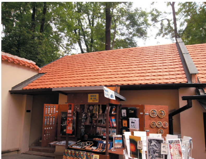
Střecha nad objektem mikve u Pinkasovy synagogy po generální opravě.

Dále se podařilo opravit střechu nad objektem mikve u Pinkasovy synagogy. Zde byla položena nová krytina z keramických tašek bobrovek. Rovněž bylo provedeno nové laťování, oprava a ochrana dřevěných prvků, oprava a doplnění klempířských prvků, jakož i difúzní izolace a nové zateplení půdy minerální izolací s ochranou proti škůdcům a s pochozí dřevěnou konstrukcí. Finančně se na opravě tohoto objektu podílela i Židovská obec v Praze, která mikve využívá. Celkové náklady na opravu představují částku ve výši 700 tisíc Kč.