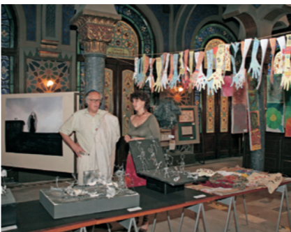
Výstava prací studentů v Jubilejní synagoze. Student work on display in the Jubilee Synagogue.

Projekt měl dvě paralelní části, výtvarnou a hudebně-dramatickou. Výtvarná část projektu byla v každé zemi zakončena výstavou. Ta pražská se uskutečnila v Jubilejní synagoze. Hudebně-divadelní část projektu byla zase završena společným představením. Anglicko-německo-české dílo, které bylo v Praze provedeno na prestižním místě ve Státní opeře, vzniklo díky spolupráci mnoha studentů a učitelů ze tří zemí. Utrpení „děti šoa“ vyjádřené v básních, deníkových zápiscích či dopisech se pro dnešní mladé lidi stalo klíčem k uchopení témat rasové nesnášenlivosti a intolerance, se kterými se sami setkávají.