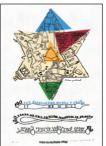
Originální sítoček Marka Podwala vydané ke 100. výročí založení ŽMP. Original silkscreen print by Mark Podwal created for the 100th anniversary of the Jewish Museum

The exhibition Visual Metaphors: The Art of Mark Podwal opened on September 22 at the new American Center in the renovated Vratislav Palace.