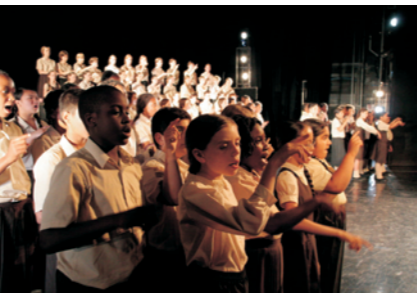
Premiéra Slyš náš hlas ve Státní opeře Praha. Premiere of Hear Our Voice in State Opera Prague.

This project comprised two parallel sections. The art section was accompanied by an exhibition in each country; the one in Prague was held in the Jubilee Synagogue. The music theatre section culminated in the performance at the prestigious State Opera Prague. The English-German-Czech work was made possible by the cooperation of the many students and teachers from each of the three countries. The expression of suffering in the poems, diaries and letters written by children of the Holocaust served to increase young people's awareness and understanding of current issues of racial hatred and intolerance.