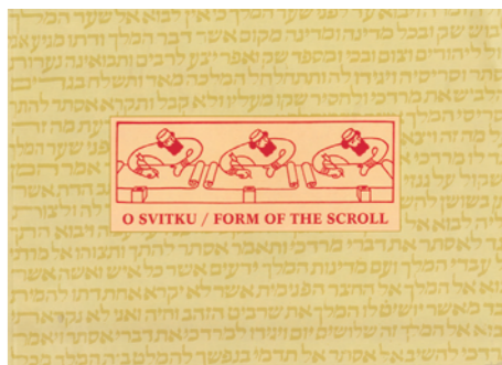
Titulní strana katalogu k výstavě O svitku. Title page of the exhibition catalogue.

As demonstrated by this exhibition, the scroll has also been an inspiration for artists, whether they create illustrative accompaniments to the Book of Esther or use its form and traditional decoration as a source of inspiration in their own work.