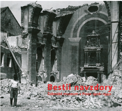
Doprovodný katalog k výstavě Bestil navzdory. Catalogue for the exhibition Defying the Beast.