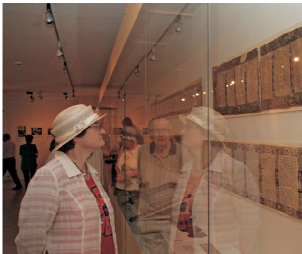
Výstava O svitku v Galerii Roberta Guttmana. Form of the Scroll exhibition in the Robert Guttman Gallery.

V závěru června byla v Galerii Roberta Guttmana zahájena výstava O svitku , jež během července představila zhruba jednu desetinu z necelých 600 svitků, které jsou uloženy ve sbírkách Židovského muzea. Na výstavě byly zastoupeny všechny typy obrádků svitků, tedy především svitek Tóry (Pentateuchu), ústřední obrádků předmět judaismu, nebo biblická kniha Ester. Krása těchto svitků spočívá především v kaligrafii hebrej-