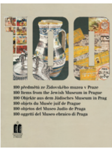
Titulní strana publikace 100 předmětů ze Židovského muzea v Praze. Title page of the publication 100 Items from the Jewish Museum in Prague.

Při příležitosti 100. výročí svého založení vydalo Židovské muzeum v Praze obrazovou publikaci, která představuje 100 nejnámějších předmětů z jeho sbírek. Během stoleté existence muzea se jejich součástí stalo skoro 40 000 předmětů, z nichž byly do knihy vybrány ty, které nejlépe reprezentují jednotlivé sbírkové fondy – textilů, kovů a ostatních materiálů, sbírku rukopisů a starých tisků a sbírku vizuálního umění. Zastoupeny