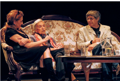
Eva Holubová s Lenkou Reinerovou a Ivanem Klímov na slavnostní večeru v Divadle Archa. Eva Holubová with Lenka Reinerová and Ivan Klíma at the gala evening at the Archa Theatre.