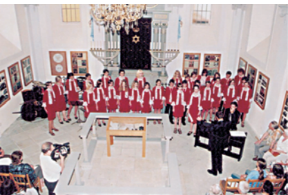
Ze slavnostního zahájení Poláčkova léta v rychnovské synagoze, kde Rychnovský dětský pěvecký sbor CARMINA zazpíval hebrejské písně. Grand opening of the Poláček Summer Festival in Rychnov Synagogue, where the Rychnov children's choir CARMINA sang Hebrew songs.

festivalu, pořádaného na počest rychnovského rodáka, spisovatele a novináře Karla Poláčka.