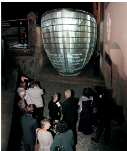
Video-socha ARCHA v bývalé Malé Pinkasově uličce. Video-sculpture ARK in the former Small Pinkas Street.

As part of the Museum's 100th anniversary celebrations, ARK will be on display until January 14, 2007.