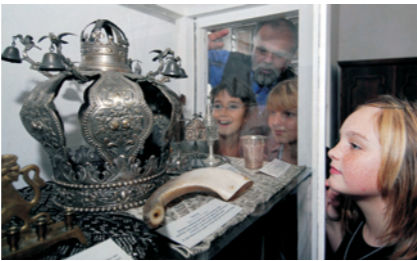
Výstava Byl jednou jeden svět. Exhibition There Was Once a World.

Sdružení Respekt a tolerance upořádalo s podporou Židovského muzea v Praze v Mohelnickém muzeu výstavu dobových fotografií, textů a trojrozměrných předmětů dokumentujících historii židovských komunit v Lošticích, Mohelnici a Úsově nazvanou Byl jednou jeden svět .