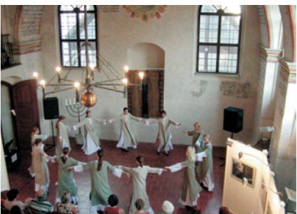
Yocheved Dance Ensemble at the Třebíč Festival. Taneční soubor Yocheved na festivalu v Třebíči.

The 3rd annual Shamayim Třebíč festival took place in the Rear Synagogue and in the Jewish Quarter.