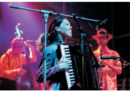
Pressburger Klezmer Band na festivalu Boskovice 2006. Pressburger Klezmer Band at the Boskovice 2006 Festival.

Od 13. do 16. července se v Boskovicích konal XIV. ročník festivalu pro židovskou čtvrť. Bylo možné navštívit přehlídku hudby nejrůznějších žánrů, divadel, filmů, výstav, výtvarných dílen a happeningů.