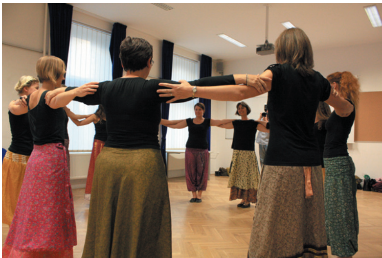
Workshop izraelských tanců

přednášce, během níž si příchozí mohli prohlédnout nově zrekonstruovanou obřadní síň, která byla pro veřejnost uzavřena téměř dva roky, následovala vlastní prohlídka hřbitova zaměřená na osudy zde pohřbených osobností kulturního a hospodářského života.