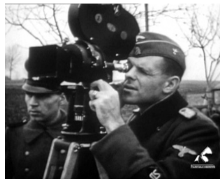
Dokumentace průběhu natáčení, 1942