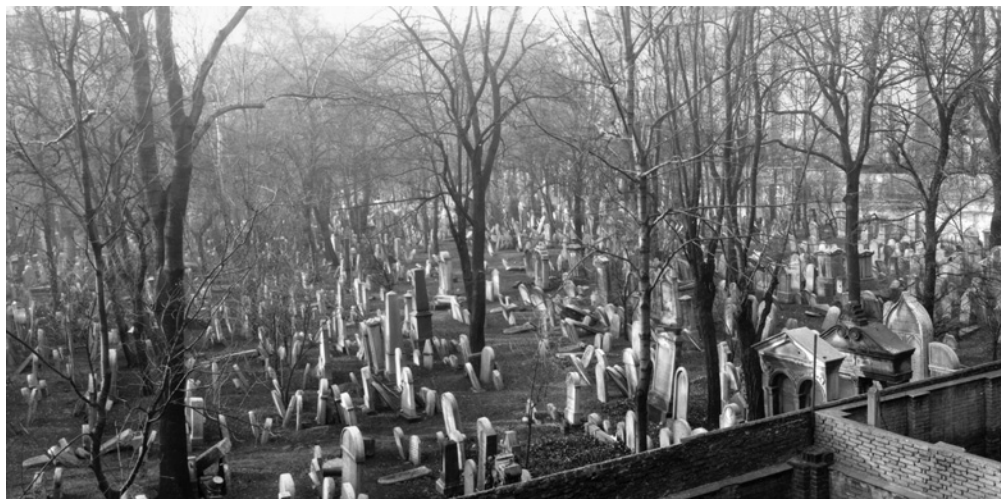
Proměny židovského hřbitova na Žižkově

Ve dnech 8.–15. září se ve spolupráci s Židovskou obcí Brno uskutečnil v prostorách brněnského Oddělení pro vzdělávání a kulturu ŽMP první ročník Týdne židovské kultury v Brně . Jeho součástí vedle workshopu tzv. kolových izraelských tanců tvořily mj. i dvě komentované prohlídky židovského hřbitova v Brně-Židenicích. Po úvodní