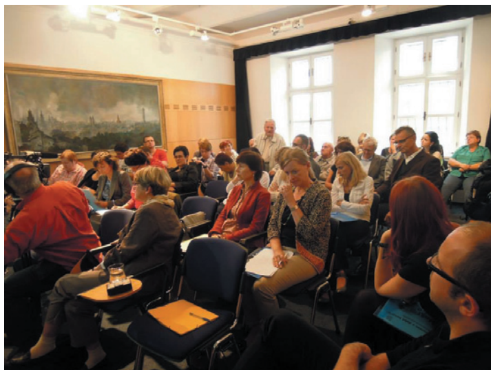
Účastníci konference „Pomoc v době bezpráví“