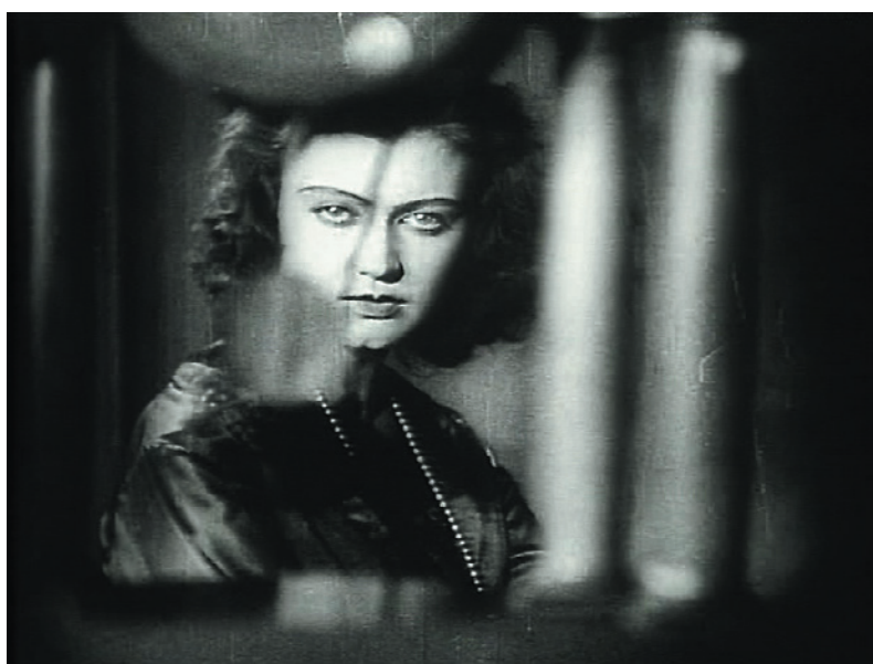
Záběr z filmu © Filмотeka narodowa, Varšava

CINEGOGA, to je cyklus, spojující němý film, živou hudbu a jedinečný architektonický prostor Španělské synagogy. V rámci již pátého ročníku Židovské muzeum v Praze, tentokrát ve spolupráci s Polským institutem v Praze, uvedlo příběh s detektivní zápletkou, natočený na motivy stejnojmenného románu vůdčí osobnosti polské moderny Stanisława Przybyszewského. Přestože jeho filmová verze vznikla na konci dvacátých let, svou sugestivitou možná předčí produkci slavných films noirs let čtyřicátých.