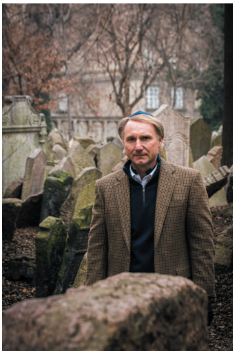
Dan Brown během své návštěvy Starého židovského hřbitova