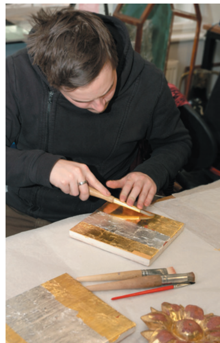
Leštění zlata achátem

Evropský sociální fond Praha & EU: Investujeme do vaší budoucnosti