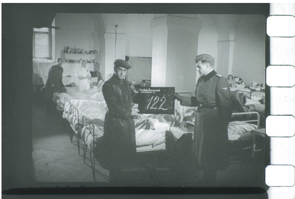
Klapka z terezínského natáčení, 1942