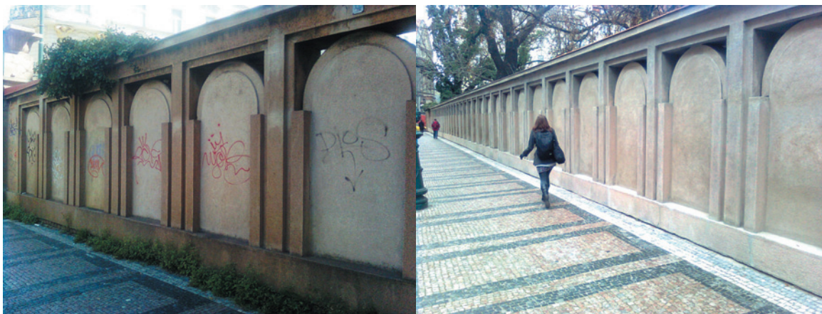
Zdi Starého židovského hřbitova před a po úpravách

Na přípravě projektu, jehož autorem je ing. Arch. Libor Kovář, i jeho následné realizaci se odborně podílela Mgr. Karin Kahancová z ústředního pracoviště Národního památkového ústavu, svými konzultacemi přispěl také Odbor památkové péče magistrátu hlavního města Prahy. Vlastní realizaci následně provedla firma ENERFINA, s. r. o., která v příslušném výběrovém řízení předložila nejvýhodnější nabídku. Realizace probíhala v období od září do poloviny prosince tohoto roku.